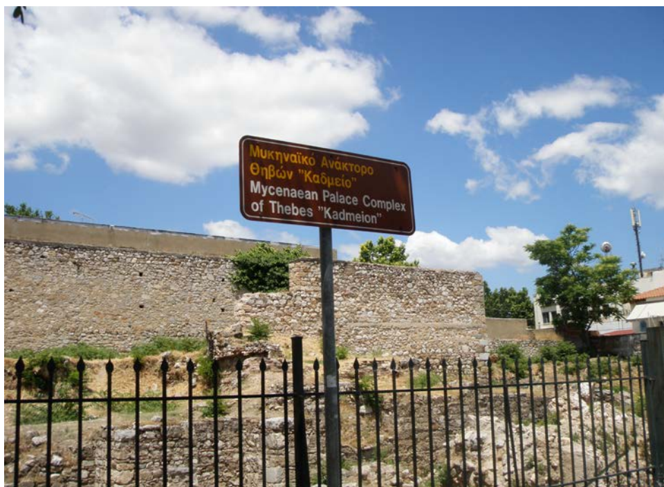
Εικ. 6.1: Μυκηναϊκό Ανάκτορο Θηβών “Καδμείο”