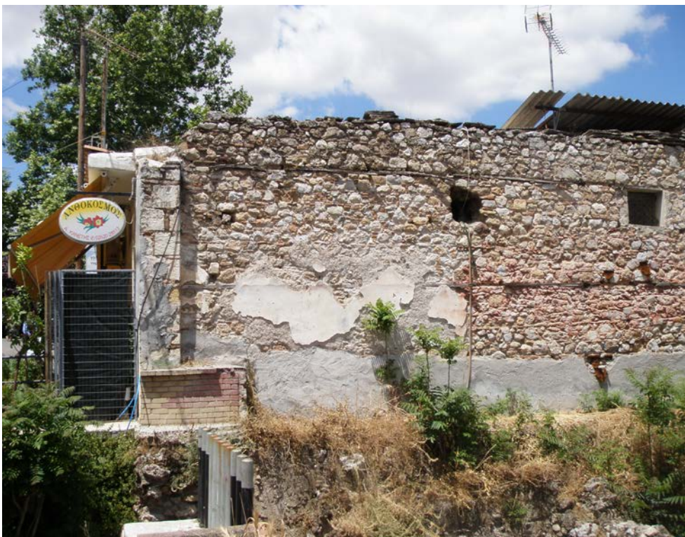
Εικ. 6.4: Αρχαιολογικός χώρος “Καδμείο”