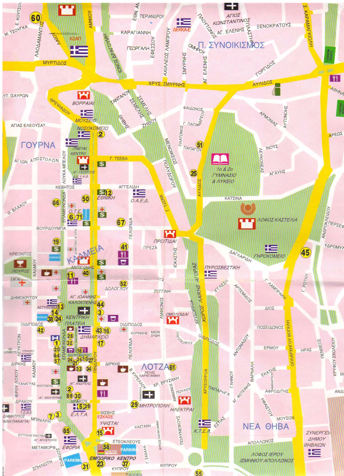
Εικ. 3.1. Χάρτης Μνημείων στο Κέντρο της Θήβας

Στο κεφάλαιο αυτό θα παρουσιάσουμε τον χάρτη μνημείων στο Ιστορικό Κέντρο της Θήβας.