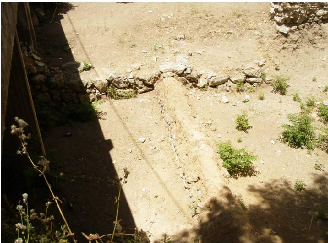
Εικ. 6.5: Αρχαιολογικός χώρος “Καδμείο”