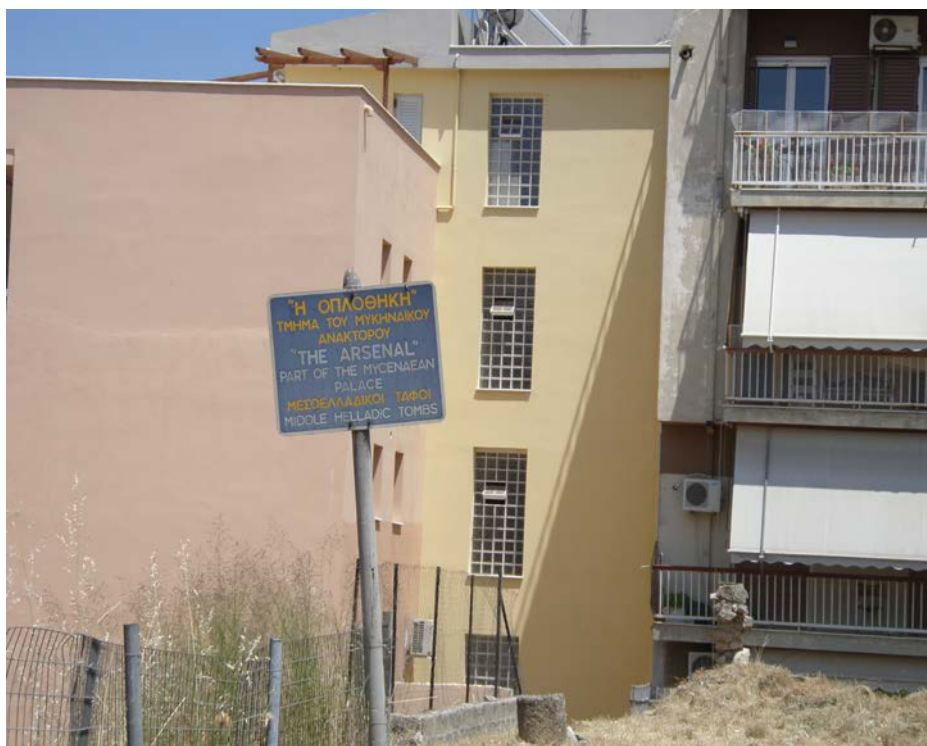
Εικ. 6.9: Οπλοθήκη