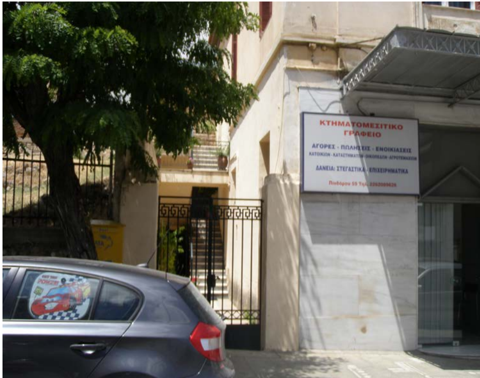
Εικ. 6.3: Αρχαιολογικός χώρος “Καδμείο”