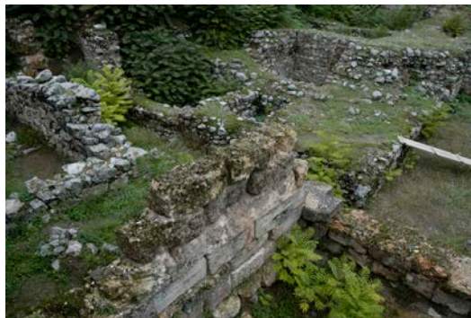
Εικ. 3.2: Τα ερείπια της Καδμείας, ακρόπολης των Θηβών