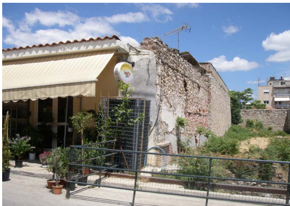
Εικ. 6.2: Αρχαιολογικός χώρος “Καδμείο”