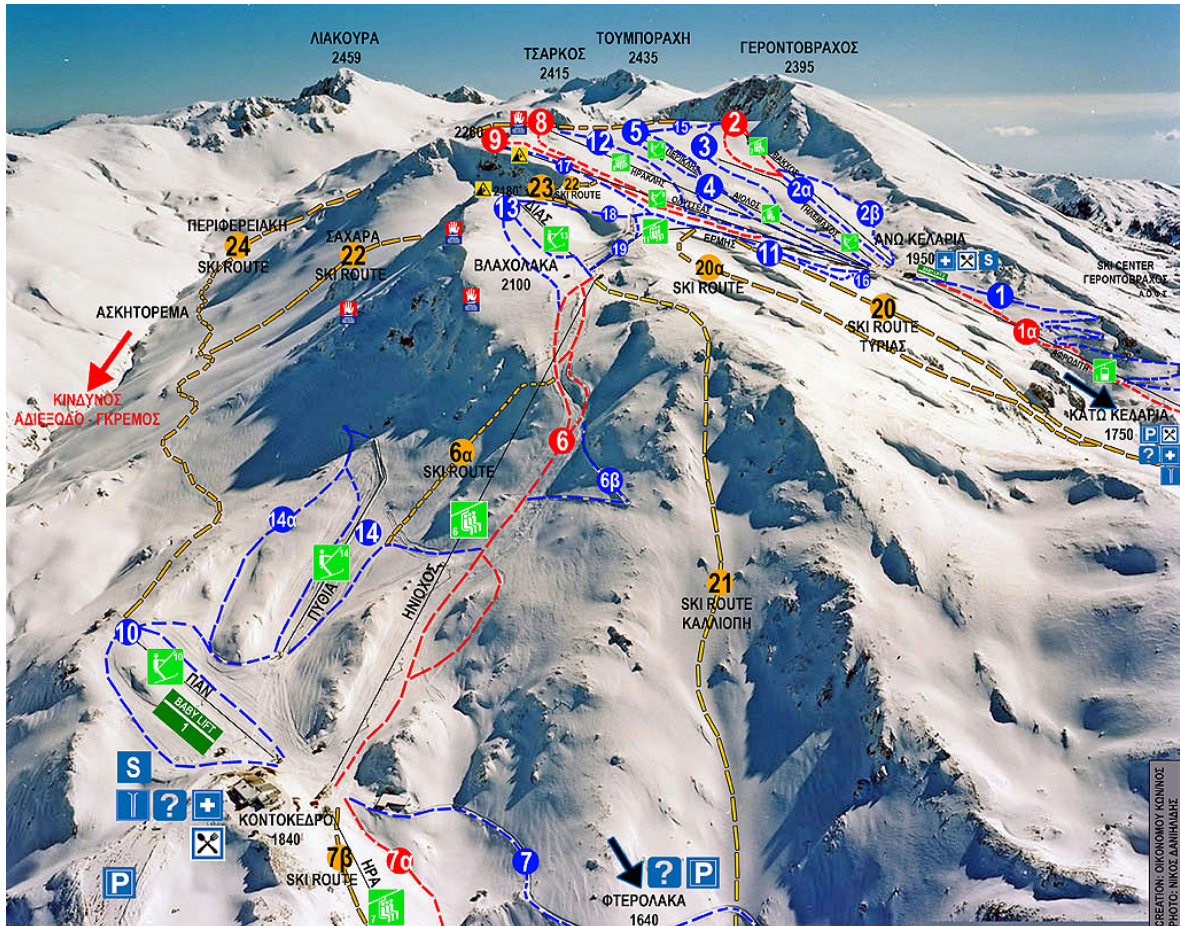
ΧΑΡΤΗΣ ΠΙΣΤΩΝ ΧΙΟΝΟΔΡΟΜΙΚΟΥ ΚΕΝΤΡΟΥ ΠΑΡΝΑΣΣΟΥ

ευρύτερης περιοχής. Χιλιάδες άνθρωποι είτε για να απολαύσουν το σκι, είτε τη φύση, είτε τα παραδοσιακά αραχωβίτικα εδέσματα επισκέπτονται την Αράχωβα καθ' όλη τη διάρκεια του έτους και κυρίως τους χειμερινούς μήνες, αφήνοντας έτσι αρκετά χρήματα τόσο στο χωριό όσο και στη γύρω περιοχή.