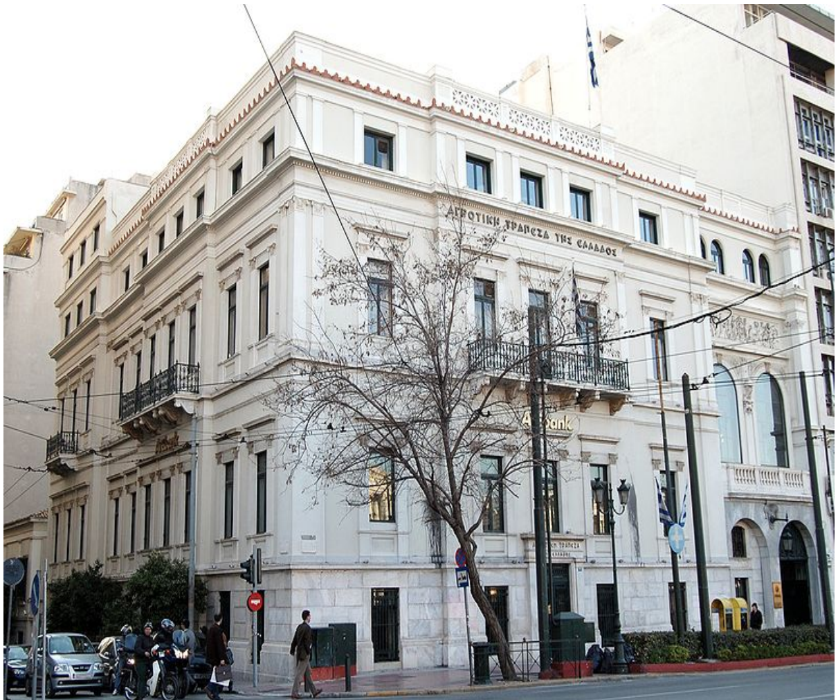
Το Αρχοντικό Σερπιέρη , κτισμένο το 1880, στο οποίο στεγαζόταν το κεντρικό κατάστημα της Αγροτικής Τράπεζας.

Στις 25 Ιουνίου 2013, ολοκληρώθηκε η ενοποίηση των πληροφοριακών συστημάτων της πρώην ΑΤΕbank με την Τράπεζα Πειραιώς, καταργήθηκαν τα εναλλακτικά δίκτυα εξυπηρέτησης και η ιστοσελίδα της ΑΤΕbank, και οι πελάτες εξυπηρετούνται πλέον από τα αντίστοιχα της Τράπεζας Πειραιώς. Σχεδόν άμεσα ξεκίνησε και η αντικατάσταση της εταιρικής ταυτότητας των καταστημάτων της πρώην ΑΤΕbank, που ως τότε διατηρούσαν την εμπορική επωνυμία ΑΤΕbank, με αυτή της Τράπεζας Πειραιώς.