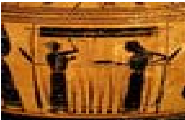
Ο αργαλειός. Μια μικρή βιοτεχνία πολλαπλών χρήσεων και παραγωγής.