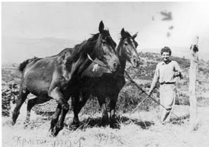
Θερισμός του σιταριού

Στον αγώνα της επιβίωσης και της αντίστασης κατά του κατακτητή η ύπαιθρος και ο αγροτικός πληθυσμός γενικώς υπέφεραν περισσότερο του αστικού πληθυσμού για το λόγω της δράσης των ανταρτικών ομάδων.