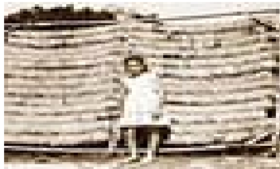
Η καλλιέργεια του καπνού

7) Η διάδοση και η ενίσχυση απ' τις καθαρά οικογενειακές οικοτεχνίες προσαρμοζόμενες προς το γεωργικό περιβάλλον με σκοπό την επικερδή απασχόληση της γεωργικής οικογένειας κατά τη νεκρή γεωργική περίοδο.