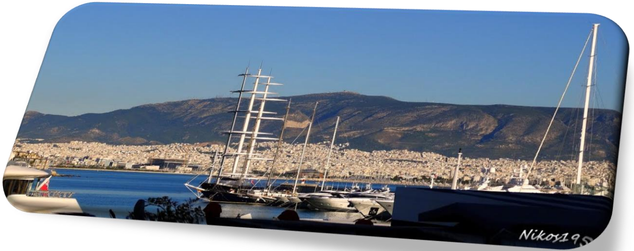
Εικόνα 12: Υμηττός