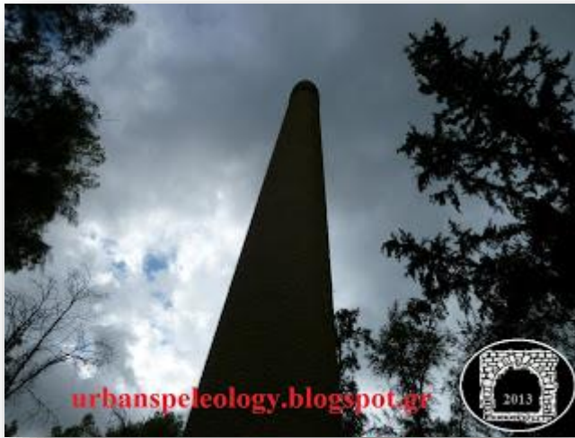
Εικόνα 6: Φουγάρο παλιού πυριτιδοποιείου