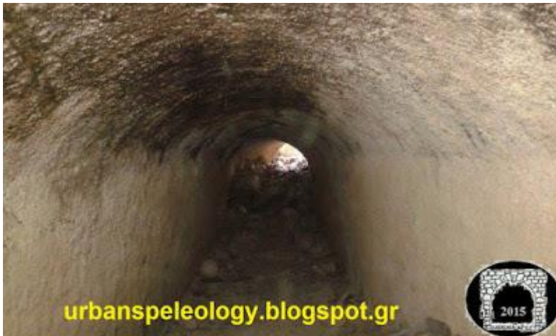
Εικόνα 5: Στοά του Μπαρουτάδικου

Στο σταθμό του μετρό μπορεί κανείς να δει αγγεία, κτερίσματα και άλλα αρχαιολογικά ευρήματα που βρήκαν κατά τη διάρκεια εκτέλεσης εργασιών του μετρό. Αυτά εκθέτονται σε ειδικές θέσεις στον διάδρομο του σταθμού.