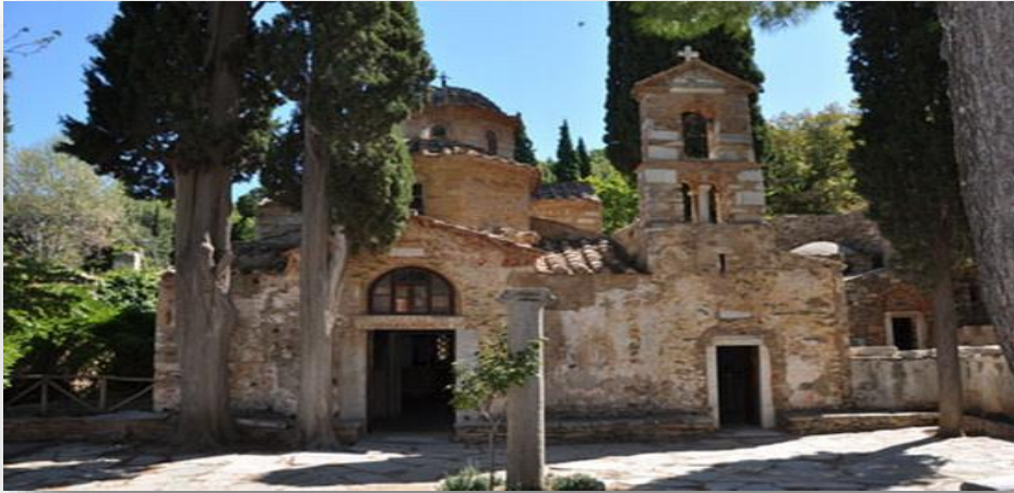
Εικόνα 7:Εκκλησία Αγ. Γεωργίου

Βύρωνα δίπλα από το στρατόπεδο σακέτα όπως