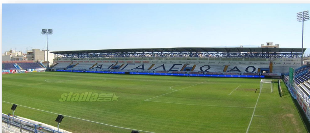
Εικόνα 3: Γήπεδο Αιγάλεω

Η ομάδα του Αιγάλεω ιδρύθηκε το 1946. Η ομάδα είχε μια καλή πορεία μέχρι το 2010 με καλές εμφανίσεις και συμμετοχή στην Α εθνική. Έχει φθάσει τρεις φορές έως τα ημιτελικά του κυπέλλου Ελλάδας, ενώ την περίοδο 2003-04 εξασφάλισε την συμμετοχή του στο κύπελλο της UEFA, όπου και έλαβε μέρος την αγωνιστική σεζόν 2004-05 και έφθασε έως τη φάση των ομίλων της διοργάνωσης. Το Αιγάλεω έχει εκτός από ομάδα ποδοσφαίρου, ομάδα μπάσκετ, βόλεϊ και κολύμβησης καθώς και έντονη αθλητική δραστηριότητα με πολλές αθλητικές εγκαταστάσεις.