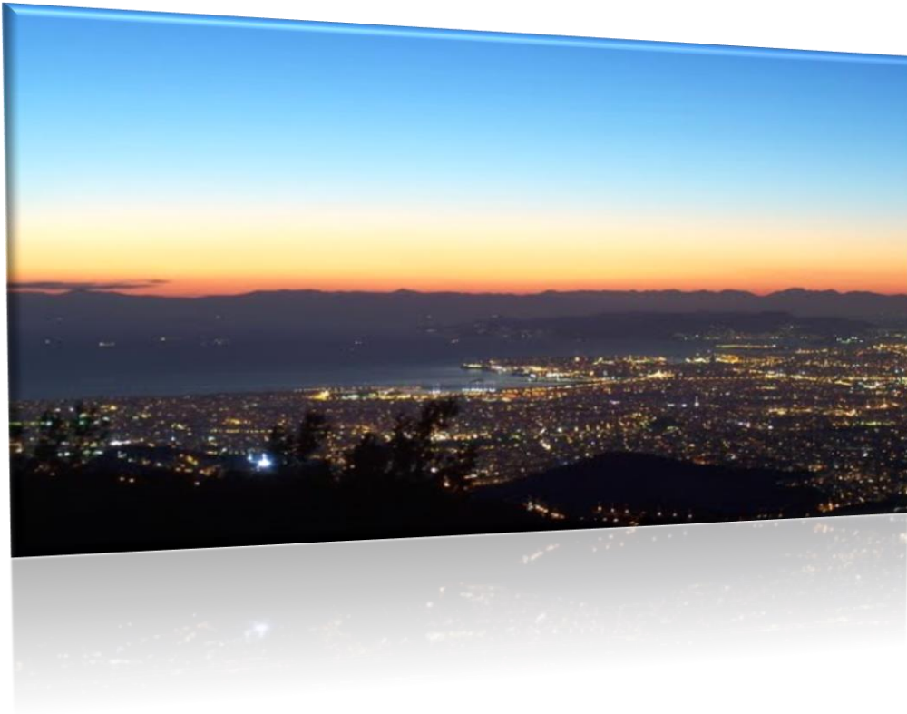
Εικόνα 11:Θέα από τον Υμηττό