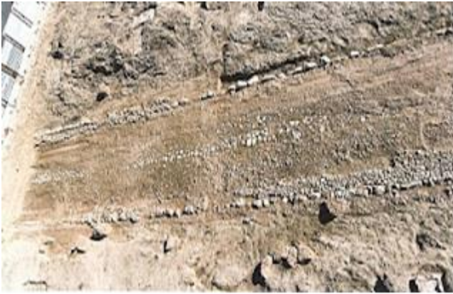
Εικόνα 4: Κομμάτι της αρχαίας Ιεράς Οδού

από το παλιό Αιγάλεω. Τέλος θα γίνει ανάδειξη της Ιεράς Οδού με τον αρχαίο δρόμο, τους τάφους και τους ναΐσκους του που είναι δίπλα στον δρόμο