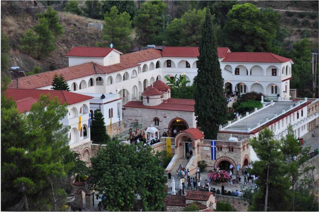
Εικόνα 8:Μονή Καισαριανής

Στο βόρειο άκρο του Υμηττού και κοντά στη βάση του Πολεμικού Ναυτικού βρίσκεται η Μονή του Αγ. Ιωάννου του Προδρόμου του Κυνηγού .