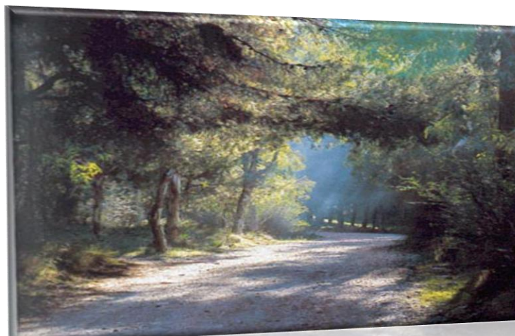
Εικόνα 10: Υμηττός

Ο δήμος Βύρωνα χαρακτηρίζεται από αστικό τοπίο με μεγάλες εκτάσεις δασικού χώρου και βοσκοτοπιών καθώς βρίσκεται στους πρόποδες του όρου Υμηττού. Ωστόσο, το κυρίαρχο περιβάλλον της περιοχής μελέτης είναι το