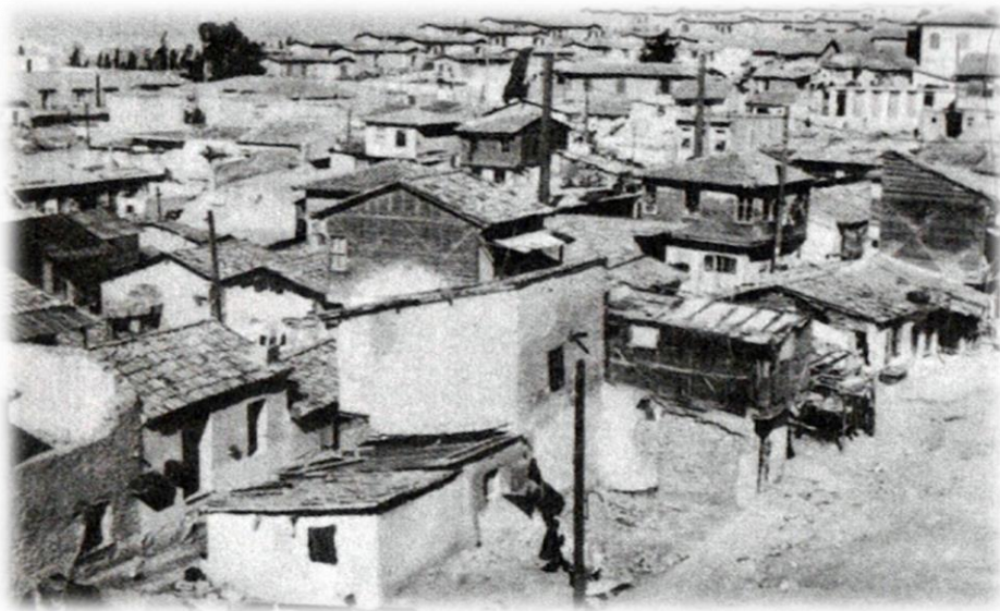
Εικόνα 1: Το Αιγάλεω της δεκαετίας του 1920