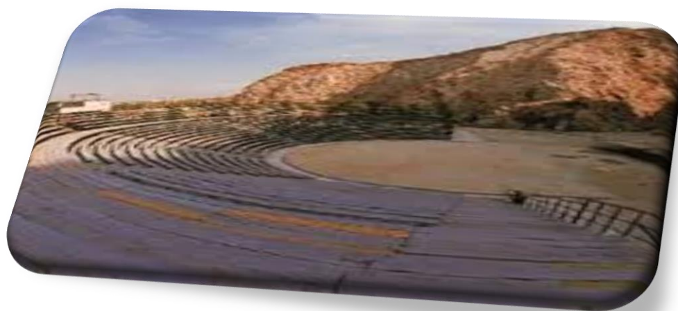
Εικόνα 9: Θέατρο Βράχων

Το θέατρο μπορεί να φιλοξενήσει 150.000 θεατές.