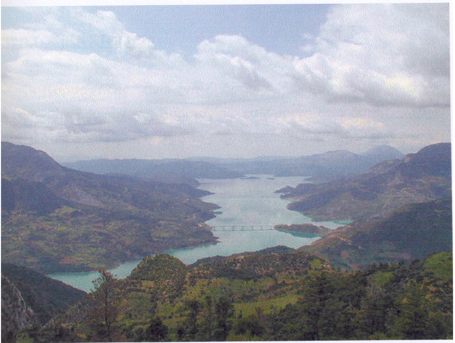
Λίμνη των Κρεμαστών