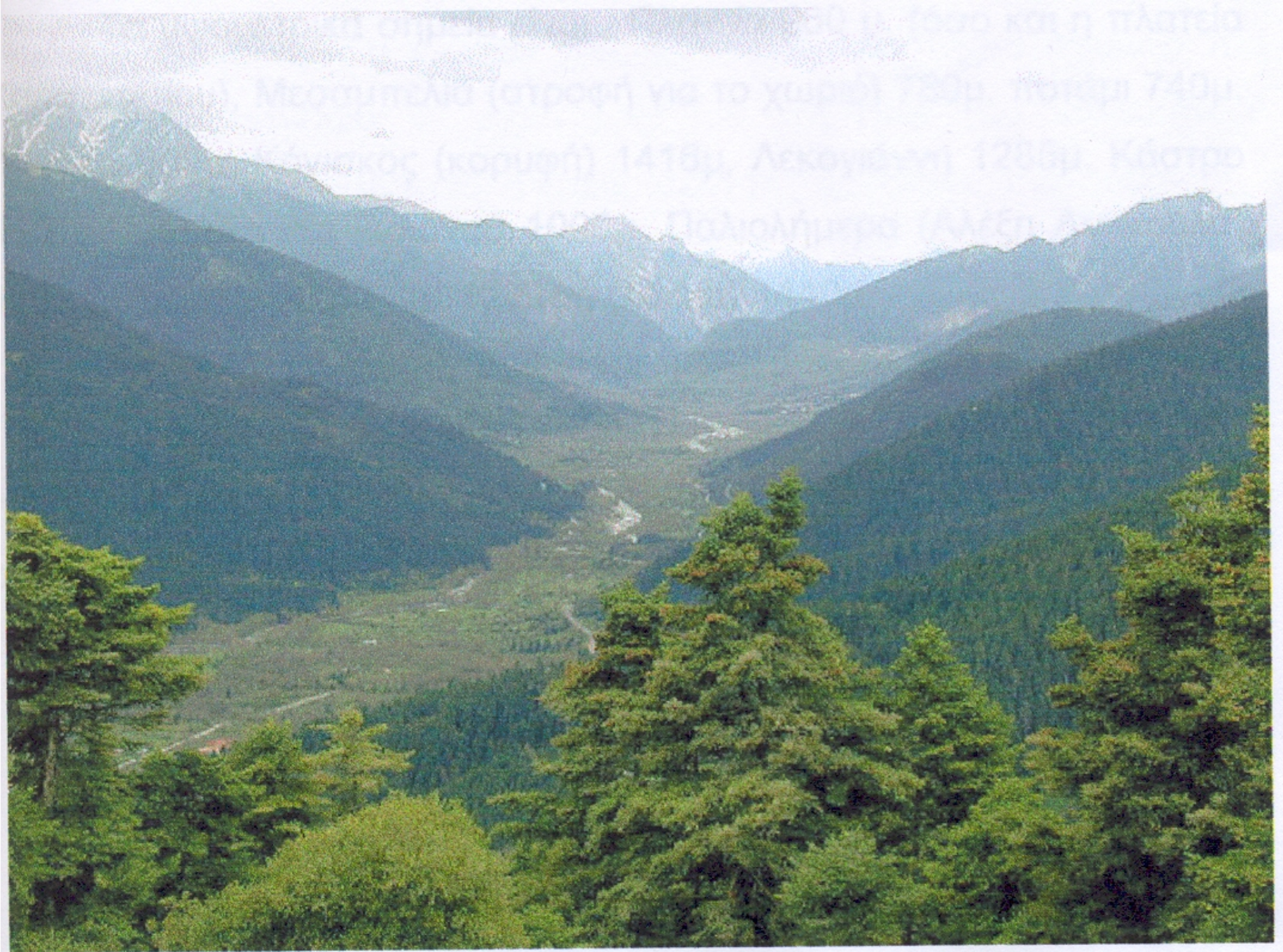
Η κοιλάδα του Καρπενησιώτη