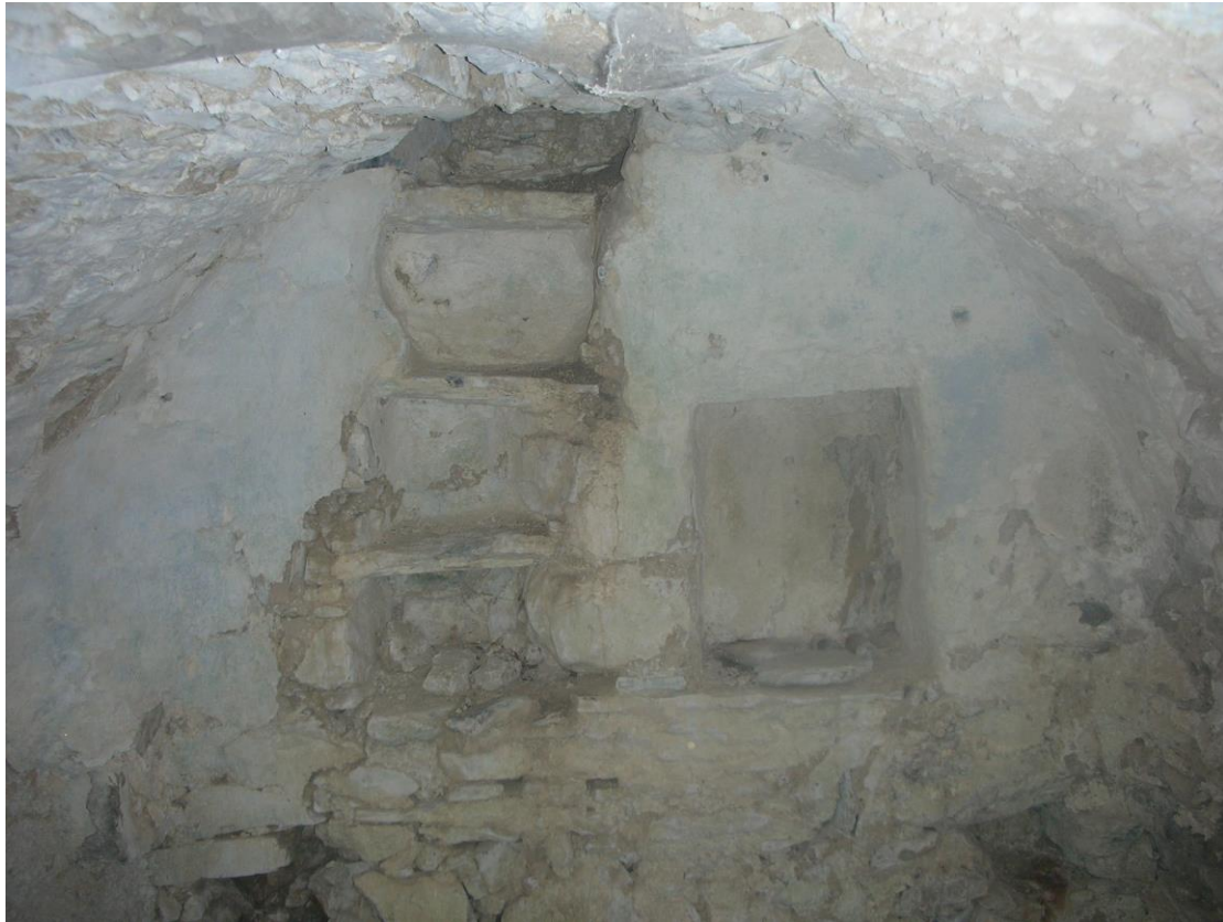
Φωτ. 2: Η κλεβανή

Βόρεια του νερόμυλου, υπήρχαν τρεις ακόμη χώροι (σχ. Α1). Ο πρώτος, πιθανολογώ πως ήταν αποθήκη ή κελάρι. Η πρόσβαση εκεί γίνεται από θύρα που βρίσκεται κάτω από τη σκάλα που υπάρχει έξω από το χώρο αυτό. Στον ανατολικό τοίχο αυτού του χώρου, τπάρχει μία πέτρινη βρύση (σχ. Α1-9). Φαίνεται πως καθώς χτίζανε, βρέθηκε στον εφαιπτόμενο βράχο πηγή, την οποία μετέτρεψαν σε βρύση, σκάβοντας το βράχο. Το νερό έτρεχε μόνιμα στη βρύση με μικρή ροή και εν συνεχεία, έπεφτε στο δάπεδο και οδηγείτω με αγωγό έξω από το σπίτι.