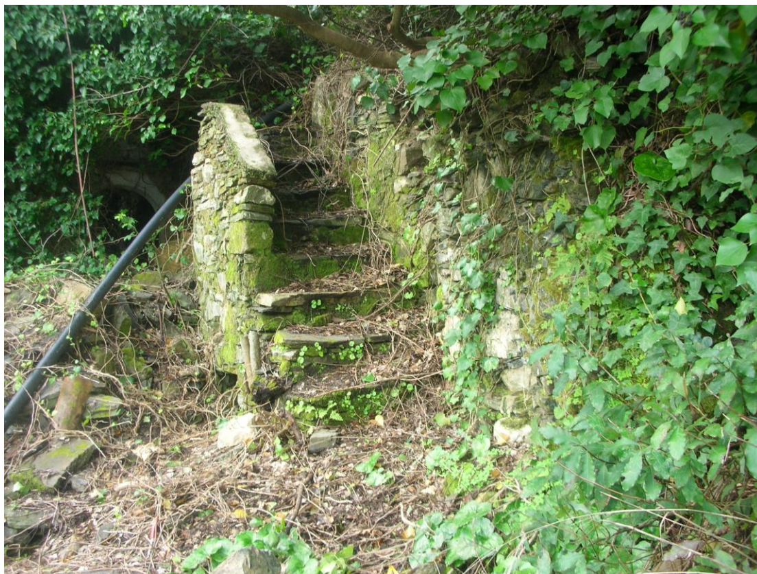
Φωτ.4: Η σκάλα που οδηγούσε στη βεράντα του Β' ορόφου, όπως σώζεται σήμερα

Στο δεύτερο όροφο, η πρόσβαση γινόταν από σκάλα που υπήρχε νότια και οδηγούσε σε βεράντα (φωτ. 4, σχ. Α3).