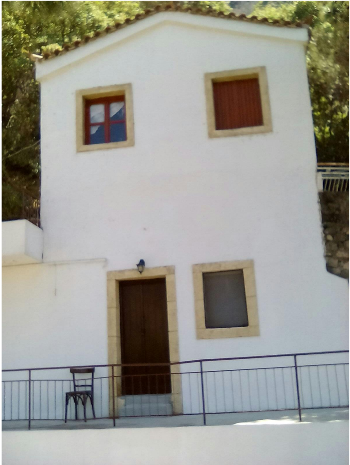
Φωτ. 11: Οίκημα με όροφο που ανήκει στην εκκλησία