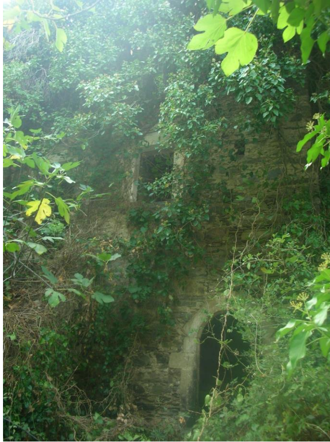
Φωτ. 9: Άποψη του κτίσματος με τα ανοίγματα