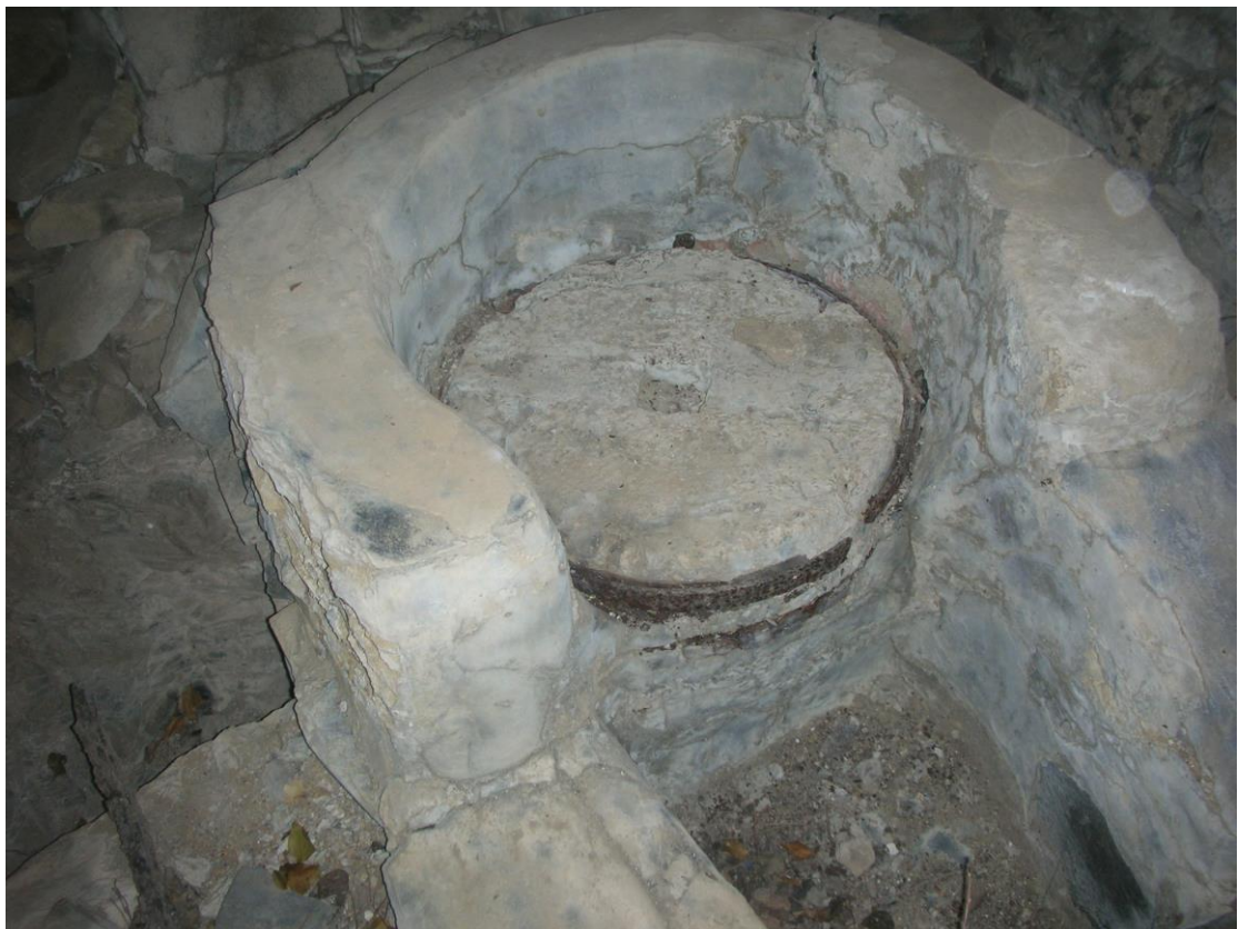
Φωτ. 8: Η κατάληξη του βουτσιού στον αλεστικό μηχανισμό