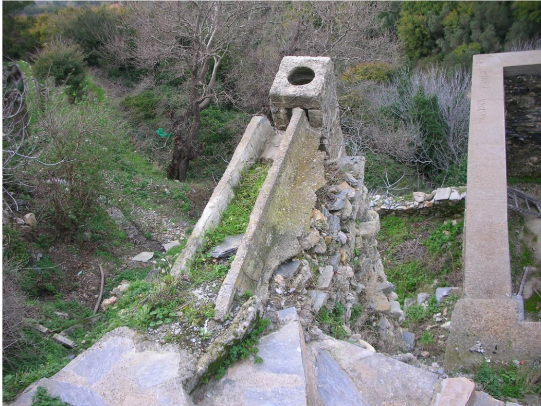
Φωτ. 5: Το οριζόντιο τμήμα το βουτσι