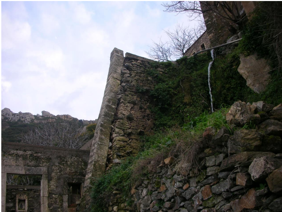
Φωτ. 6: Το κατακόρυφο τμήμα από το βουτσι