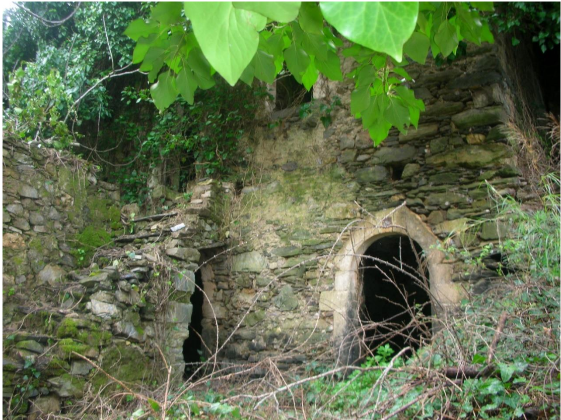
Φωτ.3: Το μπότζιο με τη σκάλα