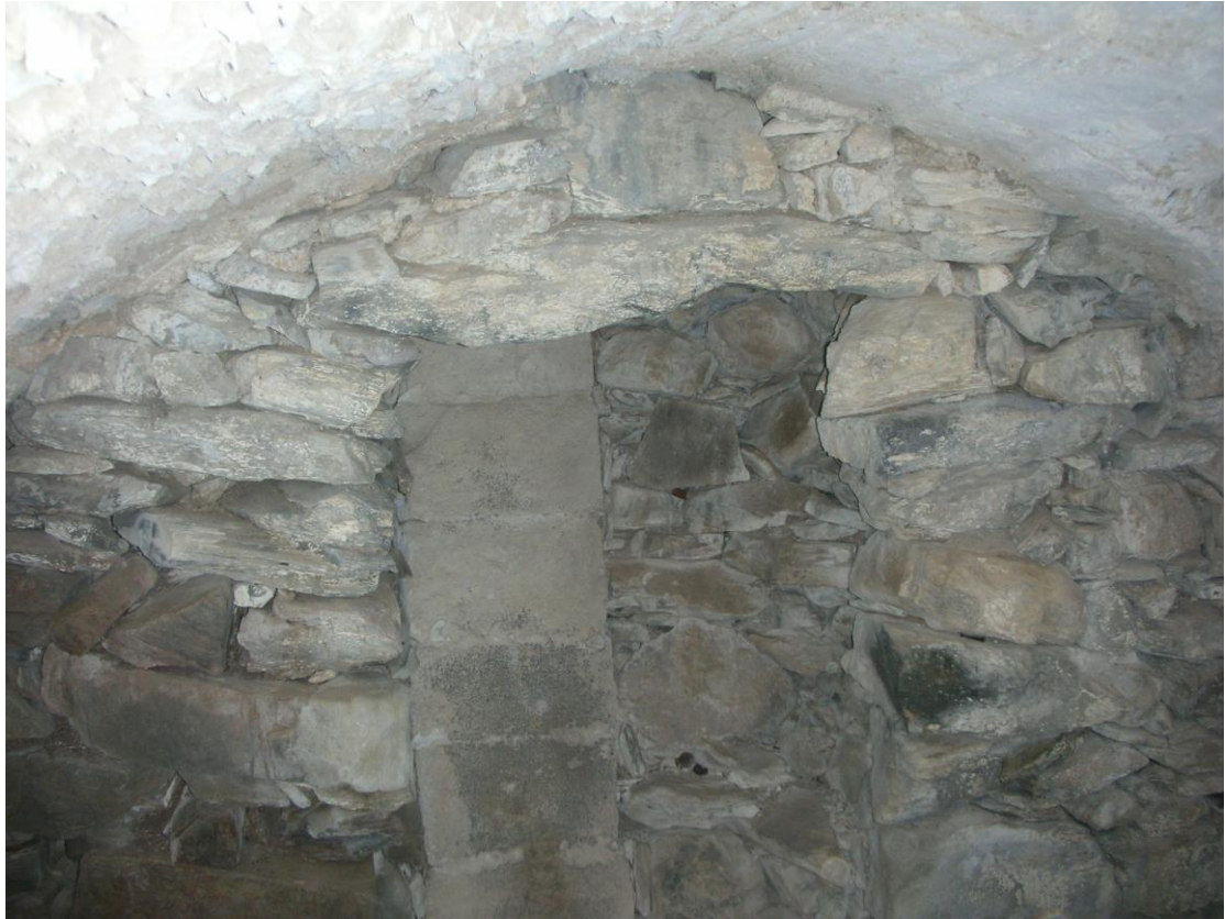
Φωτ. 7: Το βουτσι μέσα στο μύλο