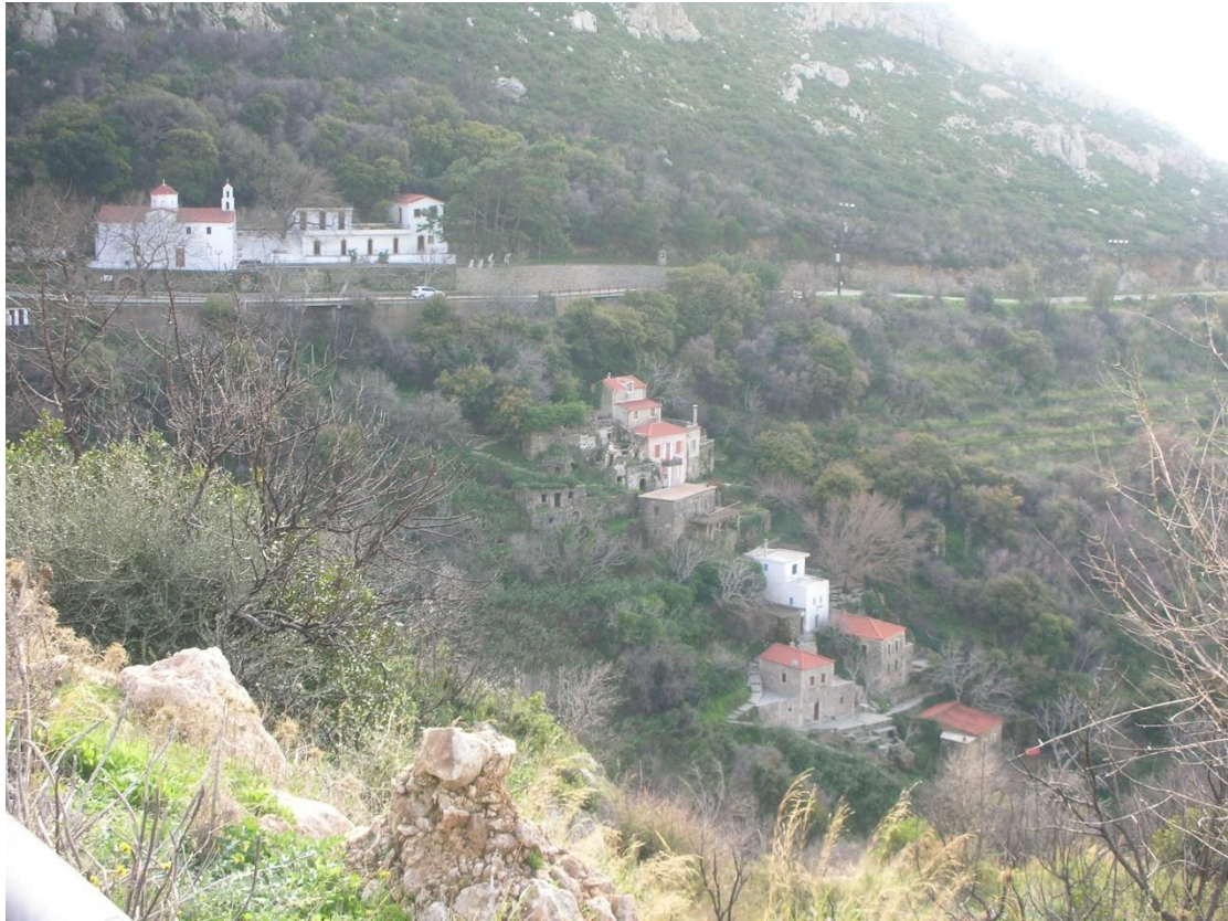
Φωτογραφία 1: Ο οικισμός

Ο σημερινός οικισμός άρχισε να οικοδομείται στα μέσα του 10 ου αιώνα. Όλα τα κτίσματα ήταν χτισμένα κατηφορικά, το ένα κάτω απ' το άλλο, ώστε να εκμεταλλεύονται το νερό, καθώς τα περισσότερα διέθεταν νερόμυλους.