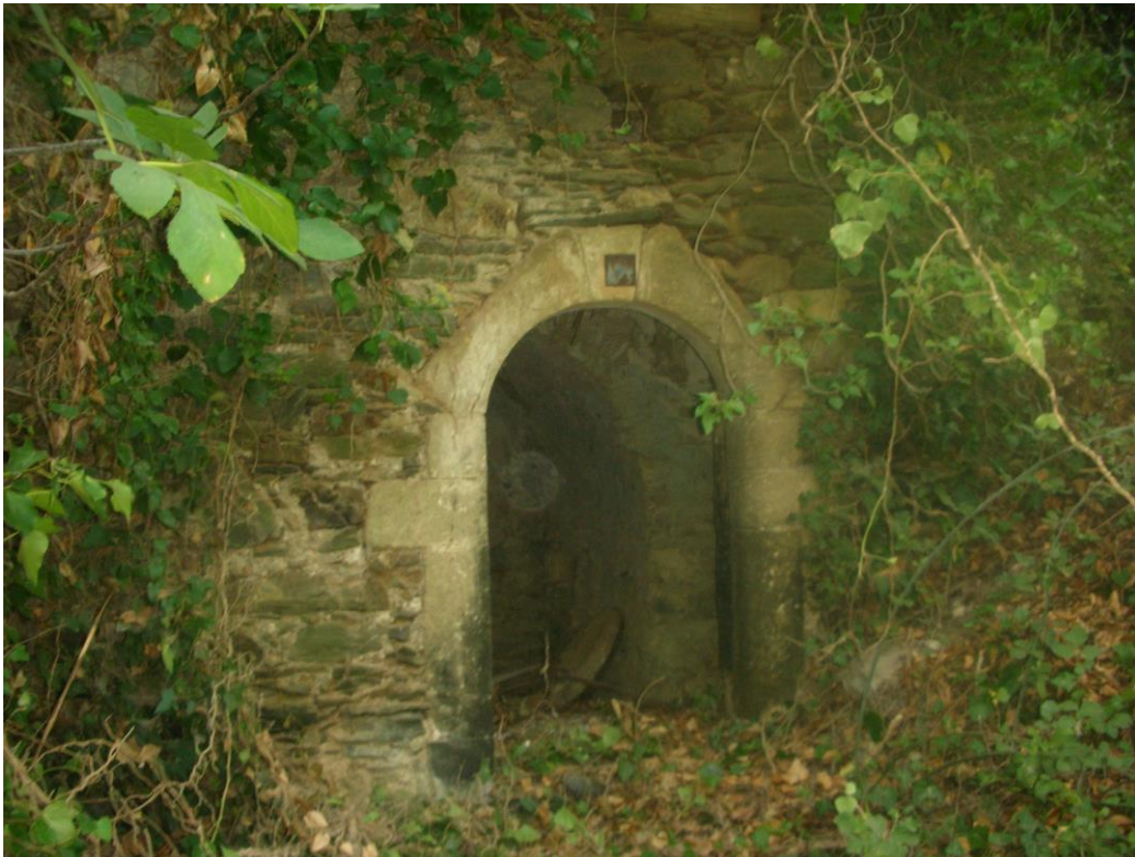
Φωτ. 10: Λεπτομέρεια Πόρτας. Μπορούμε να διακρίνουμε τον πωρόλιθο γύρω από το άνοιγμα