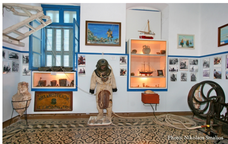
Εικόνα 7. Ναυτικό Μουσείο Καλύμνου.

Η Κάλυμνος είναι ένα νησί με μεγάλη παράδοση στην σπογγαλιεία. Έχει χαρακτηριστεί ως το νησί των σφουγγαράδων. Δίκαια την ονόμασαν έτσι, αφού ήταν και είναι ένα από τα μεγαλύτερα διεθνή κέντρα επεξεργασίας και εμπορίας σφουγγαριών. Μετά τον Β' παγκόσμιο πόλεμο ήταν το μόνο νησί που έκανε εξαγωγές σφουγγαριών σε Ελλάδα και εξωτερικό.