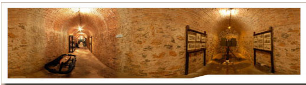
Εικόνα 6. Πολεμικό Μουσείο Λέρου

Η Λέρος στον Β' Παγκόσμιο Πόλεμο λειτούργησε ως βάση των Ιταλών. Την επιλογή αυτή την έκαναν λόγω της γεωφυσικής της θέσης και λόγω του ότι διαθέτει ένα φυσικό λιμάνι, το λιμάνι του Λακκίου. Αυτό το λιμάνι είναι εξαιρετικά ασφαλές διότι όσα μποφόρ και αν επικρατούν στην θάλασσα τα νερά σε εκείνο το σημείο είναι ήρεμα και μπορεί εύκολα κάθε πλοίο να αράξει.