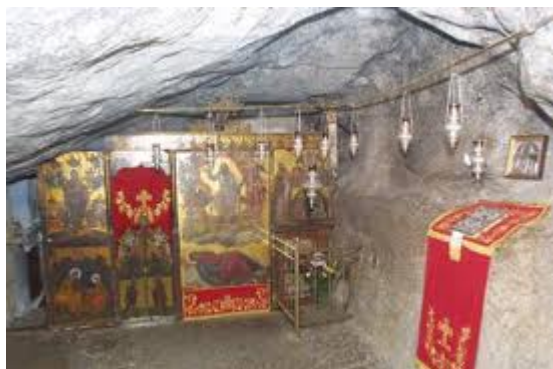
Εικόνα 5. Το σπήλαιο της Αποκάλυψης.

Στο νησί της Πάτμου έζησε ο Ευαγγελιστής Ιωάννης μέσα σε μια σπηλιά, στο σπήλαιο της Αποκάλυψης, για 2 ολόκληρα χρόνια, από το 95 έως το 97 μ. Χ. Εκεί λέγεται πως ο Ιωάννης είδε ένα όραμα κατά το οποίο του φανερώθηκε ο Θεός και σύμφωνα με το οποίο έγραψε το 27 ο και τελευταίο βιβλίο της Καινής Διαθήκης.