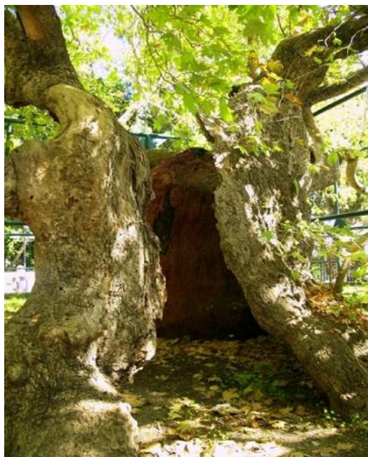
Εικόνα 5. Πλάτανος του Ιπποκράτη

Ο Πλάτανος του Ιπποκράτη είναι ένα από τα αρχαιότερα δέντρα στην Ευρώπη και η ηλικία του είναι 2.400 χρόνια. Η περίμετρός του είναι 10,50 μέτρα και η διάμετρος του κορμού του 4,70 μέτρα. Δεν υπάρχει κάποια είσοδος, όπου πληρώνεις κάποιο εισιτήριο για να περάσεις στον χώρο όπου δεσπόζει ο Πλάτανος, αφού το αρχαίο δέντρο βρίσκεται σε κεντρικό σημείο της πόλης της Κω μέσα σε μία πλατεία. Είναι επίσης δίπλα στο λιμάνι και κοντά στο κάστρο των Ενετών.