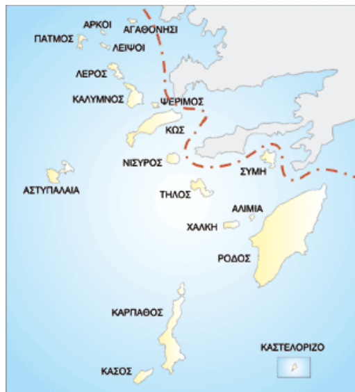
Εικόνα 1.: Ο χάρτης των Δωδεκανήσων