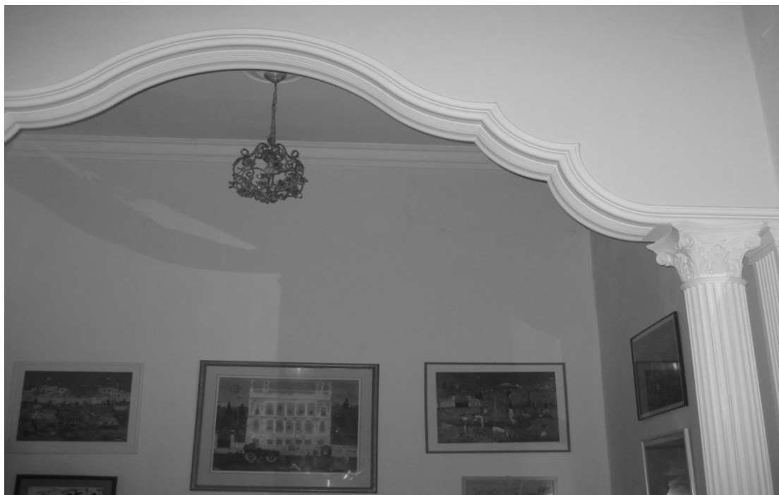
Εικόνα 13 – Λεπτομέρεια καμάρα εσωτερικού χώρου (σαλόνι) νεοκλασικού κτιρίου στην οδό Κάνιγγος 14, Πειραιάς.