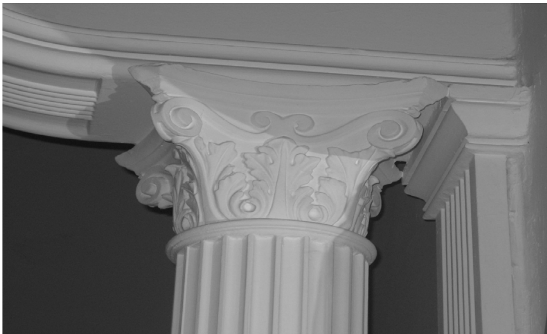
Εικόνα 12 - Λεπτομέρεια κολώνας-καμάρας εσωτερικού χώρου, από γύψο. (σαλόνι) νεοκλασικού κτιρίου στην οδό Κάνιγγος 14, Πειραιάς.