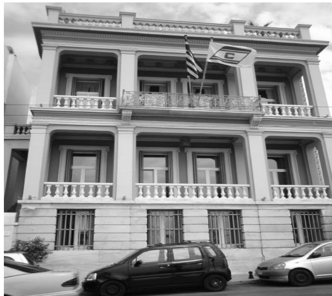
Εικόνα 30 – Πρόσοψη νεοκλασικού κτιρίου στην οδό Ακτή Κουντουριώτη 13 (προσωπικό αρχείο).