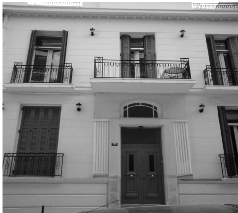
Εικόνα 23 - Πρόσοψη νεοκλασικού κτιρίου στην οδό Μεσσηνίας 7 (προσωπικό αρχείο).

Έργο του Ziller χτισμένο στις αρχές του 20 ου αιώνα. [8]