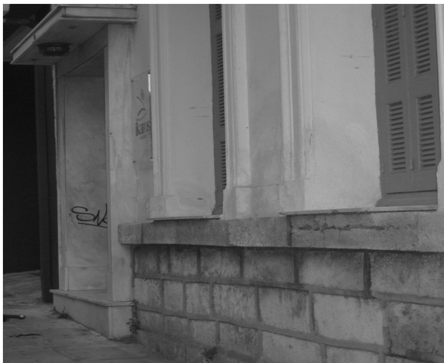
Εικόνα 3 – Όψη νεοκλασικού κτιρίου στην οδό Κάνιγγος 14, Πειραιάς.

Γίνεται χρήση παραστάδων, των οποίων ο κορμός ελάχιστα προεξέχει από το επίπεδο του τοίχου, έτσι ώστε να τονίζεται διακριτικά η κατακόρυφη οργάνωση των παραθύρων. Πάνω από τις παραστάδες τρέχει ο θριγκός, ο οποίος καταλήγει στο κύριο γείσο, που οριοθετεί την επίστεψη του κτιρίου.