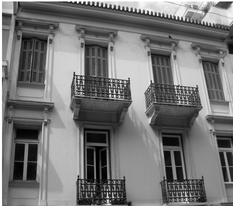
Εικόνα 20 - Πρόσοψη νεοκλασικού κτιρίου στην οδό Κάνιγγος 8.

Στην έννοια της αρχιτεκτονικής κληρονομιάς, περιλαμβάνονται παραδοσιακά κτίρια, οικιστικά σύνολα, παραδοσιακοί οικισμοί, ιστορικά κέντρα και γενικότερα τα στοιχεία του ανθρωπογενούς περιβάλλοντος με ιδιαίτερη ιστορική, πολεοδομική, αρχιτεκτονική, λαογραφική, κοινωνική και αισθητική φυσιογνωμία και αξία. Η προστασία και ανάδειξη της πολιτιστικής κληρονομιάς αποτελεί υποχρέωση του Κράτους και της πολιτείας και πιο συγκεκριμένα προστατεύεται από το Σύνταγμα. Υπάρχουν μέτρα και κίνητρα για την προστασία της αρχιτεκτονικής κληρονομιάς από την έναρξη της διαδικασίας χαρακτηρισμού διατηρητέου καθώς δεν επιτρέπεται η εκτέλεση οικοδομικών εργασιών ή οποιαδήποτε αλλαγή, αλλοίωση ή καταστροφή του κτιρίου ακόμη και αν οφείλεται σε φαινόμενα όπως σεισμός, πυρκαγιά, πλημμύρα ή κατεδάφιση και δημιουργεί την υποχρέωση στον ιδιοκτήτη του, να το επαναφέρει στην αρχική του μορφή. Τα παρακάτω κτίρια που παρουσιάζονται, βρίσκονται στην περιοχή της Καστέλας και σύμφωνα με το ΦΕΚ 420/Δ/87 έχουν κηρυχτεί διατηρητέα.