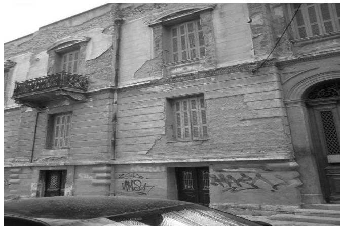
Εικόνα 34 – Πρόσοψη νεοκλασικού κτιρίου στην οδό Ουίλωνος 7.