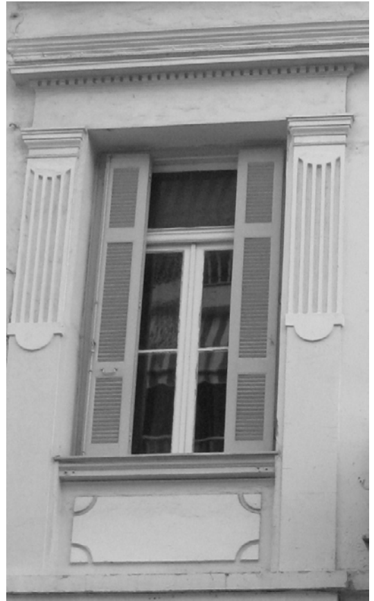
Εικόνα 11– Λεπτομέρεια εξωτερικού παραθύρου Α' ορόφου όψης νεοκλασικού σπιτιού στην οδό Κάνιγγος 14, Πειραιάς.