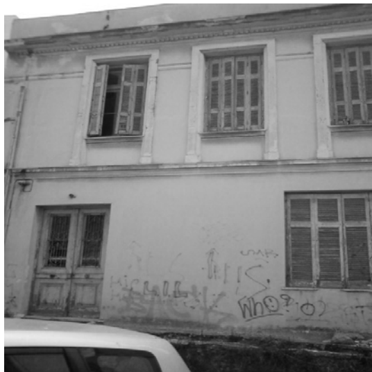
Εικόνα 32 – Πρόσοψη νεοκλασικού κτιρίου στην οδό Βαλανάκη.