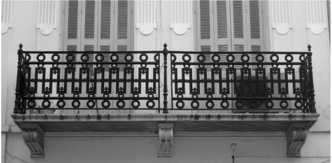
Εικόνα 4 – Όψη προβόλου Α' ορόφου του νεοκλασικού κτιρίου στην οδό Κάνιγγος 14, Πειραιάς.

κάτι τέτοιο. Εδώ το ανώτερο όριο αυτής της αδιάσπαστης ζώνης βρίσκεται στο ύψος της ποδιάς των παραθύρων του ισογείου.