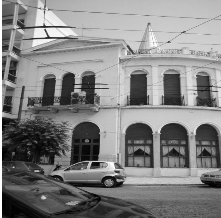
Εικόνα 22 - Όψη νεοκλασικού κτιρίου στην οδό Ακτή Κουντουριώτη 1 (προσωπικό αρχείο).

Ακτή Κουντουριώτη 1: (Ιταλικό Προξενείο) Οικία «Πατσιάδου» στην προκυμαία της Ζέας. Εύστοχη προσαρμογή των όγκων του οικοδομήματος στην καμπύλη χάραξη του δρόμου. Το ισόγειο ήταν εξαρχής διαμορφωμένο για εμπορική εκμετάλλευση.