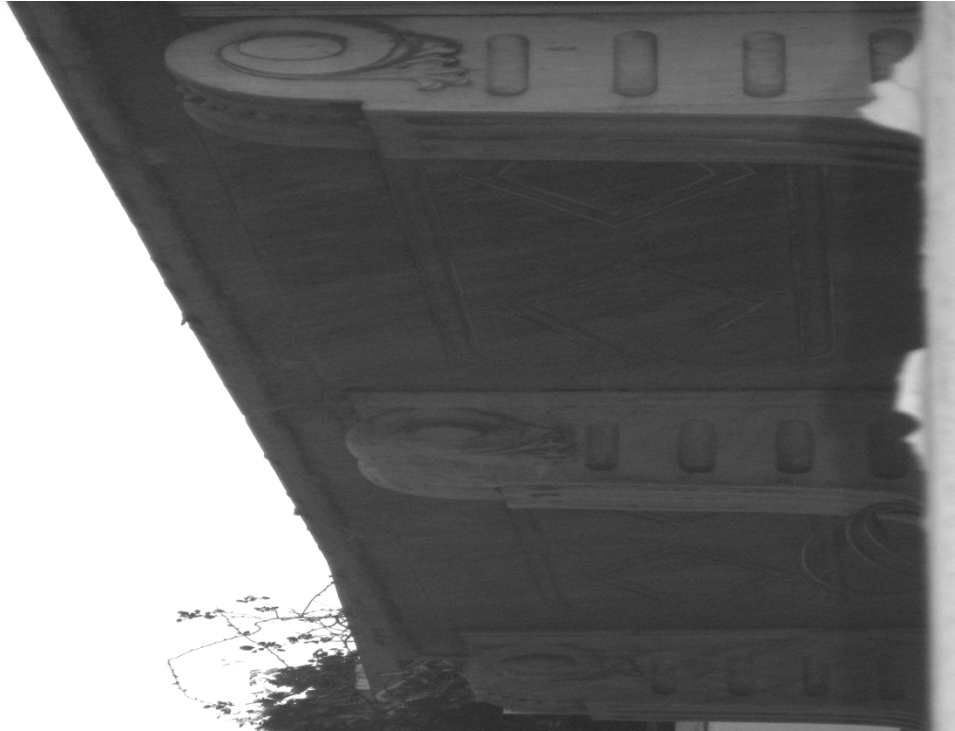
Εικόνα 5 – Λεπτομέρεια προβόλου Α' ορόφου νεοκλασικού κτιρίου στην οδό Κάνιγγος 14, Πειραιάς.