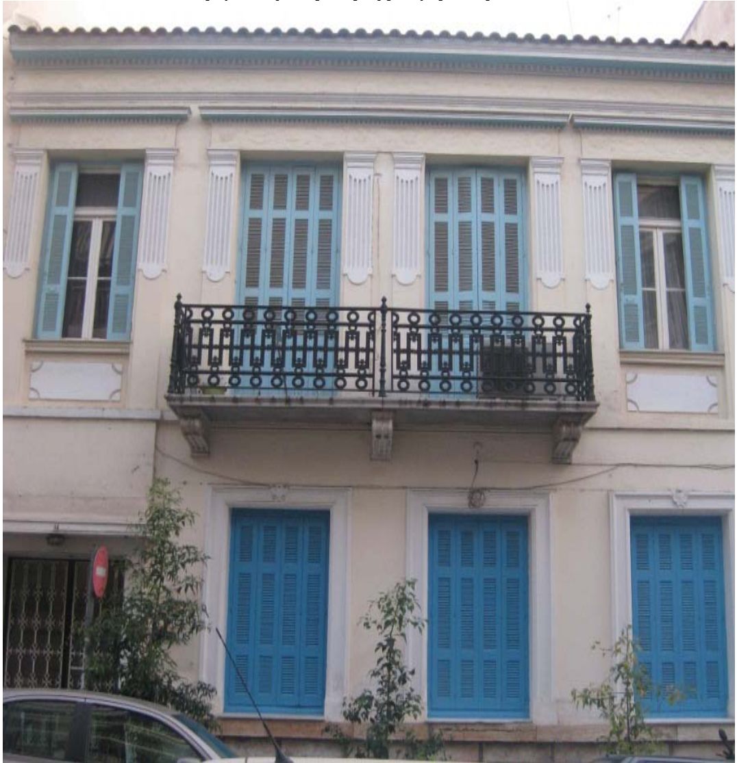
Εικόνα 2-Κύρια όψη νεοκλασικού κτιρίου στην οδό Κάνιγγος 14, Πειραιάς.

Η διακόσμηση της πρόσοψης ήταν πιο πλούσια στον όροφο απ' ότι στο ισόγειο. Με πολύ πιο απλές γραμμές τα πλαίσια των παραθύρων (παραστάδες) στο ισόγειο, σε σχέση με του ορόφου.