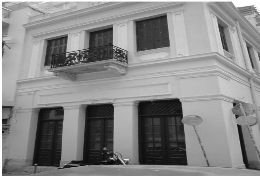
Εικόνα 26 – Πρόσοψη νεοκλασικού κτιρίου στην οδό Ουίλσονος 5.

Ουίλσονος 4: Διώροφο κτίριο με ημιυπόγειο, σε δύο ενότητες, με εσωτερική αυλή. Στο διώροφο τμήμα της πρόσοψης, υπάρχουν νεοκλασικού σχεδίου και φουρούσια. Στην άκρη της όψης υπάρχουν πεσσοί με επίκρανα. Τα ανοίγματα έχουν πλαίσιο με κυμάτια. Υπάρχουν περιμετρικές λωρίδες με κυμάτια, διαχωριστική ταινία ορόφου, γείσο και στηθαίο. Στο μονώροφο τμήμα, υπάρχουν οι πόρτες εισόδου, με κάγκελα νεοκλασικού σχεδίου και στηθαίο με πεσσίσκους. Η εσωτερική σκάλα έχει κάγκελα νεοκλασικού σχεδίου. Η κάλυψη του αποτελείτε από δώμα και η υφιστάμενη κατάσταση διατηρήσεως είναι μέτρια. [11]