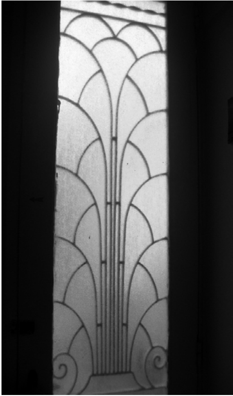
Εικόνα 8 – Λεπτομέρεια θύρας Α' ορόφου νεοκλασικού κτιρίου στην οδό Κάνιγγος 14, Πειραιά