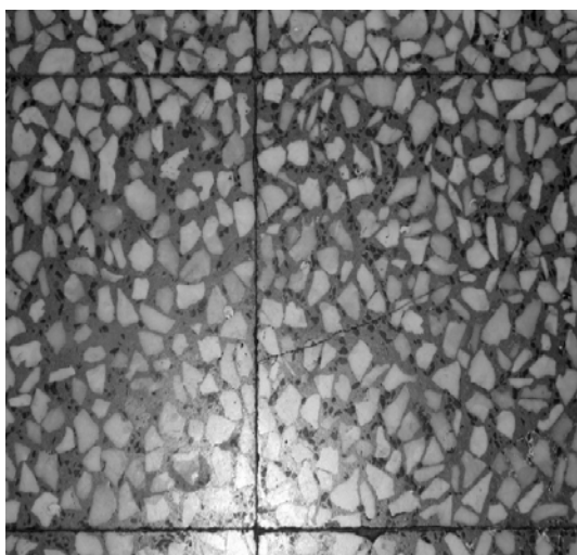
Εικόνα 18 – Λεπτομέρεια μωσαϊκού πατώματος κουζίνας Α' ορόφου νεοκλασικού κτιρίου στην οδό Κάνιγγος 14, Πειραιάς.