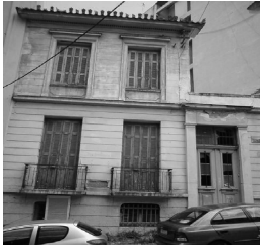
Εικόνα 33 – Πρόσοψη νεοκλασικού κτιρίου στην οδό Θρασύβουλου 1.