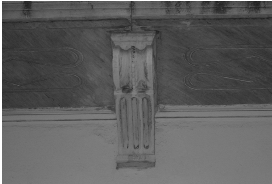
Εικόνα 6 - Λεπτομέρεια προβόλου Α' ορόφου νεοκλασικού κτιρίου στην οδό Κάνιγγος 14, Πειραιάς .

Χαρακτηριστικά είναι τα φουρούσια του εξώστη αποτελούμενα από έναν έλικα, πλευρικά ελαφρώς καμπυλόσχημα. Δίνοντας έτσι την αίσθηση της ποιότητας του γλυπτού διακόσμου, με την αρμονική χάραξη των πλευρικών ελίκων, το απαραίτητο φύλο άκανθα στη βάση του, τους μίσχους και τα άνθη κρίνου, που εκφύονται από τη μασχάλη του έλικα.