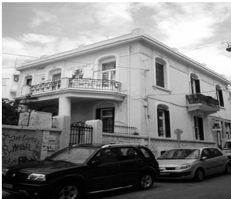
Εικόνα 27 – Πρόσοψη & πλάγια όψη νεοκλασικού κτιρίου στην οδό Ουίλσονος 28.

και δευτερεύοντες στη μεγάλη όψη. Μπαλκόνι με μαντεμένιο κιγκλίδωμα, με πολύ ωραίο σχέδιο, μαρμάρινα φουρούσια σκαλιστά και επιρροές μπαρόκ στη διακόσμηση του ορόφου. Η κάλυψη του αποτελείται από δώμα και η υφιστάμενη κατάσταση διατηρήσεως είναι μέτρια [12]