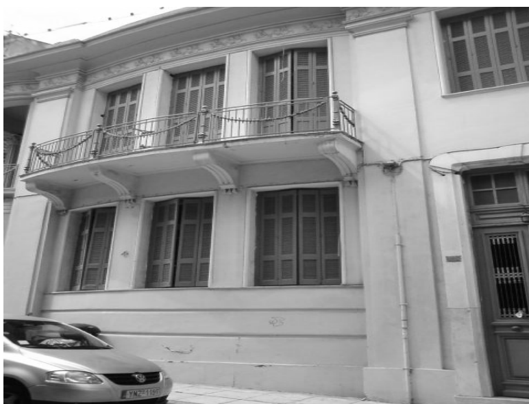
Εικόνα 24 - Πρόσοψη νεοκλασικού κτιρίου στην οδό Μεσσηνίας 20.

Μεσσηνίας 7 : Νεοκλασικό διώροφο με πολλές εκλεκτικιστικές επιρροές ελληνικού τύπου βάση, κορμός, στέψη με ταραύσα και κορνίζα. Άξονας συμμετρίας δευτερεύοντες. Ψευδοϊσόδομα τραβηχτά επιχρίσματα σ' όλη την όψη. Η υφιστάμενη κατάσταση διατηρήσεως είναι καλή. [9]