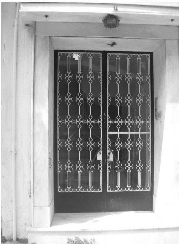
Εικόνα 7 –Λεπτομέρεια κύριας εισόδου νεοκλασικού κτιρίου στην οδό Κάνιγγος 14, Πειραιάς .

Η κεντρική είσοδος του ισογείου είναι μεταλλική και δίφυλλη.