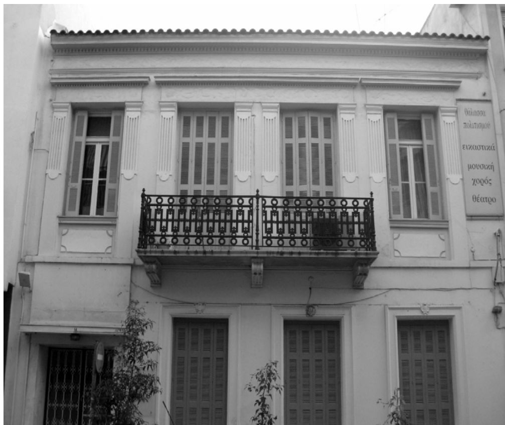
Εικόνα 1 - Πρόσοψη νεοκλασικού κτιρίου, Κάνιγγος 14, Πειραιάς