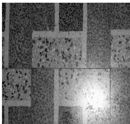
Εικόνα 19 – Λεπτομέρεια μωσαϊκού πατώματος δωματίου Α' ορόφου νεοκλασικού κτιρίου στην οδό Κάνιγγος 14, Πειραιάς (προσωπικό αρχείο).