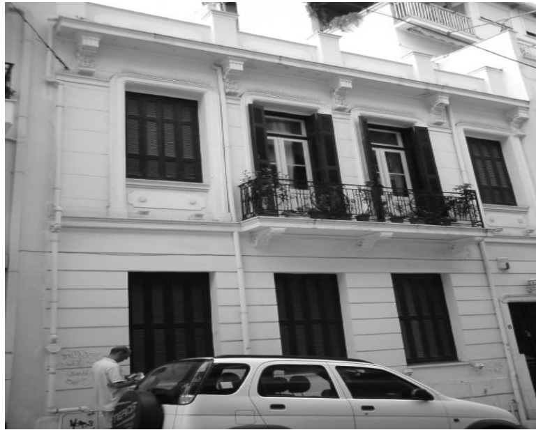
Εικόνα 21 - Πρόσοψη νεοκλασικού κτιρίου στην οδό Καρατζά 6.

Οι δύο κεντρικοί άξονες τονίζονται από τα μπαλκόνια, που διαθέτουν κάγκελα νεοκλασικού σχεδίου και ανάγλυφα φουρούσια. Τα ανοίγματα πλαισιώνονται από πεσσούς, ανάγλυφους γεισίποδες επιστυλίου και γείσου με ακροκέραμα και οδοντωτή ταινία. Η κάλυψη του αποτελείται από στέγη, ενώ η υφιστάμενη κατάσταση διατηρήσεως του είναι μέτρια. [6]