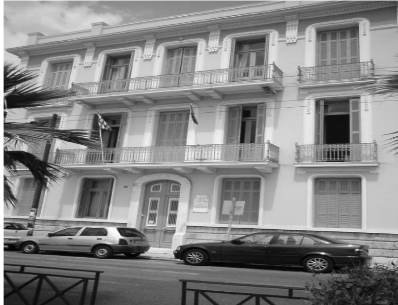
Εικόνα 28 – Πρόσοψη νεοκλασικού κτιρίου στην οδό Ακτή Κουντουριώτη & Κάνιγγος & Ουίλσονος, ΠΙΚΠΑ (προσωπικό αρχείο).

Ακτή Κουντουριώτη & Κάνιγγος & Ουίλσονος: Ίδρυμα ΜΑΖΑΡΑΚΑΤΩΝ-ΤΡΑΥΛΑΚΑΤΩΝ (Μαζαράκειο). [14]