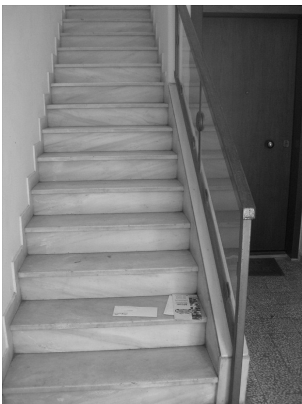
Εικόνα 14 – Λεπτομέρεια κλίμακας στον άξονα της κύριας εισόδου, για πρόσβαση στον όροφο από μάρμαρο νεοκλασικού κτιρίου στην οδό Κάνιγγος 14, Πειραιάς.