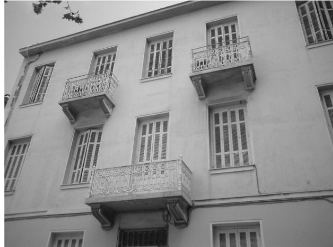
Εικόνα 29 – Πρόσοψη νεοκλασικού κτιρίου στην οδό Σανταρόζα 17.

διδασκτική τους αποστολή, βασικός λόγος και συνθήκη διατήρησης της αρχιτεκτονικής μας παράδοσης, να μειωθεί, εξακολουθούν, με όποια μορφή και αν έχουν σήμερα να διδάσκουν τεχνική, τέχνη, αισθητική, να αποκαλύπτουν μια πτυχή της νεότερης ιστορίας μας, εικόνα μιας κοινωνίας διαφορετικής της σημερινής, και να αποτελούν τεκμήρια της μετάβασης από τον παραδοσιακό στον σύγχρονο πολιτισμό.