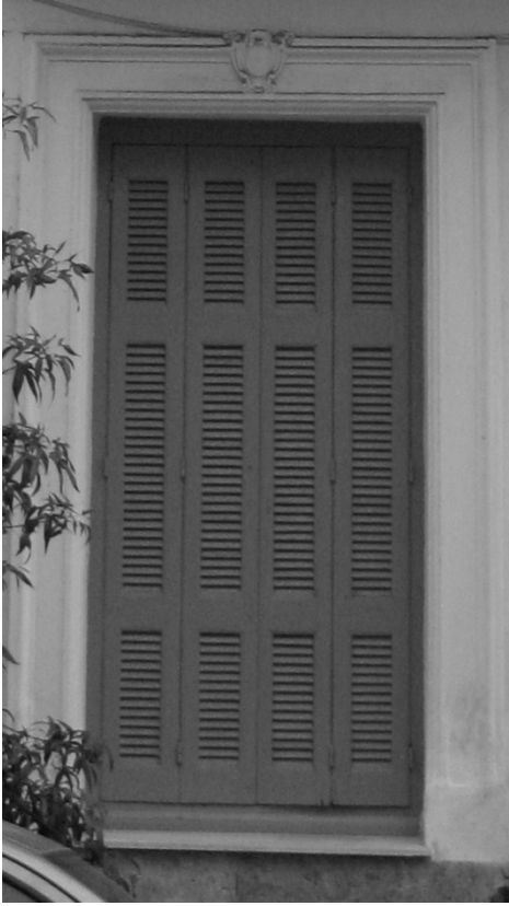
Εικόνα 10 – Λεπτομέρεια εξωτερικού παραθύρου ισογείου όψης νεοκλασικού κτιρίου στην οδό Κάνιγγος 14, Πειραιάς.