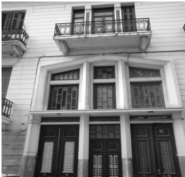
Εικόνα 31 – Πρόσοψη νεοκλασικού κτιρίου στην οδό Μεσσηνίας 22.