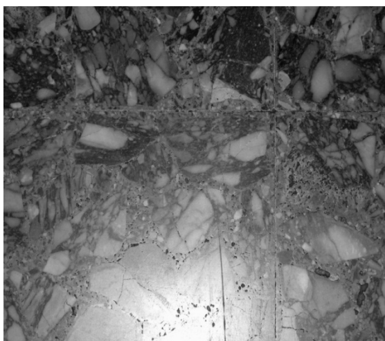
Εικόνα 16 – Λεπτομέρεια μωσαϊκού πατώματος εισόδου Α' ορόφου νεοκλασικού κτιρίου στην οδό Κάνιγγος 14, Πειραιάς (προσωπικό αρχείο).