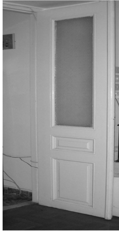
Εικόνα 9- Λεπτομέρεια θύρας νεοκλασικού κτιρίου στην οδό Κάνιγγος 14, Πειραιάς.