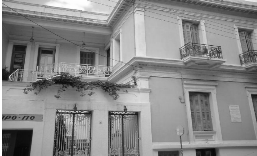
Εικόνα 25 – Πρόσοψη νεοκλασικού κτιρίου στην οδό Ουίλσονος 4 (προσωπικό αρχείο).

Ουίλσονος 4: Διώροφο κτίριο με ημιυπόγειο, σε δύο ενότητες, με εσωτερική αυλή. Στο διώροφο τμήμα της πρόσοψης, υπάρχουν νεοκλασικού σχεδίου και φουρούσια. Στην άκρη της όψης υπάρχουν πεσσοί με επίκρανα. Τα ανοίγματα έχουν πλαίσιο με κυμάτια. Υπάρχουν περιμετρικές λωρίδες με κυμάτια, διαχωριστική ταινία ορόφου, γείσο και στηθαίο. Στο μονώροφο τμήμα, υπάρχουν οι πόρτες εισόδου, με κάγκελα νεοκλασικού σχεδίου και στηθαίο με πεσσίσκους. Η εσωτερική σκάλα έχει κάγκελα νεοκλασικού σχεδίου. Η κάλυψη του αποτελείτε από δώμα και η υφιστάμενη κατάσταση διατηρήσεως είναι μέτρια. [11]