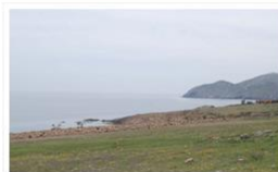
Οι Ακτές μας