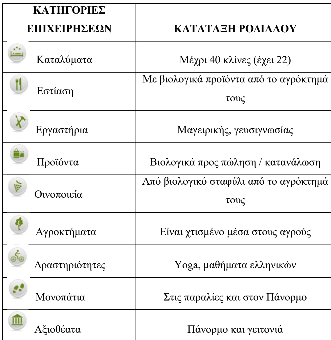
Πίνακας 2 Κατάταξη Ροδιάλου