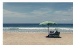
Πάνορμο και γειτονιά