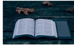
Μαθήματα Ελληνικής Γλώσσας