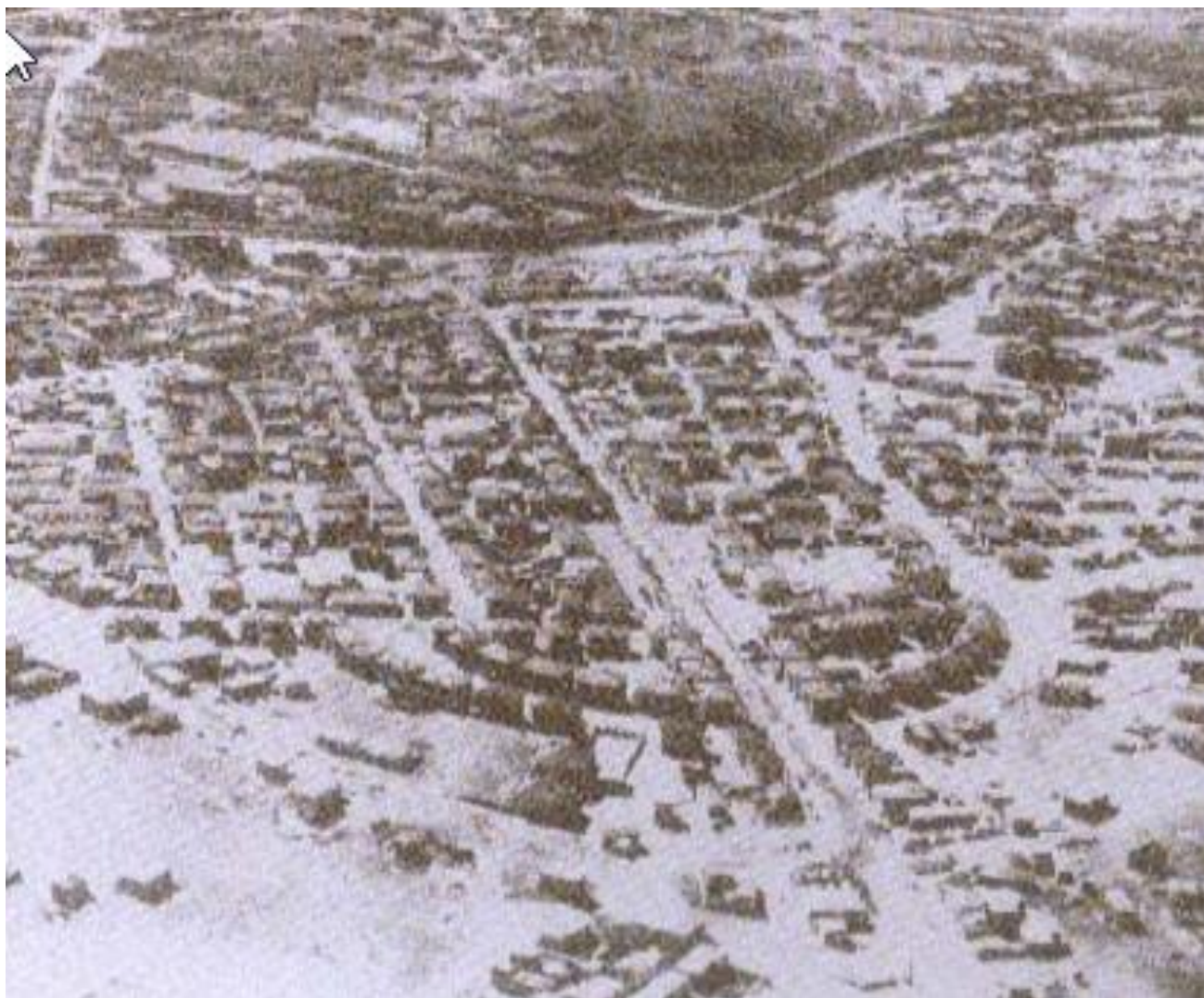
Εικόνα 3:αεροφωτογραφία της Νέας Ιωνίας το 1928(ΚΕ.ΜΙ.ΠΟ.)

Έτσι σιγά σιγά όσο παίρνουν τα χρόνια η Νέα Ιωνία μετατρέπεται σε ένα μεγάλο παραγωγικό και εμπορικό κέντρο εντός του Λεκανοπεδίου Αττικής και με το Ρυθμιστικό Σχέδιο της Αθήνας (Ρ.Σ.Α.) του 1985 (Ν.1515/85) εδραιώνεται ο ρόλος της ως διοικητικό και εμπορικό κέντρο υπεροπτικής σημασίας, ένας ρόλο που διατηρεί και μετά την τροποποίηση του Ρ.Σ.Α. του 1992.