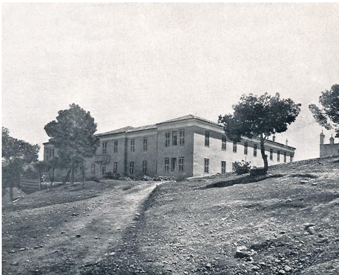
Εικόνα 4: ΚΩΝΣΤΑΝΤΟΠΟΥΛΕΙΟ