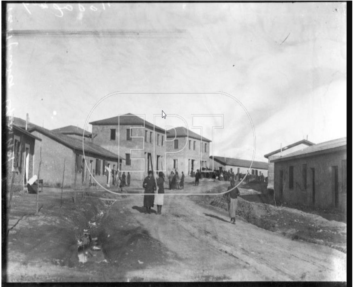
Εικόνα2: Ποδαράδες Νέα Ιωνία, οι διπλοκατοικίες και οι τετρακατοικίες

Οι πρώτες προσφυγικές συνοικίες που δημιουργήθηκαν ονομάστηκαν Ινέπολη, Ελευθερούπολη, Σαφράμπολη, Περισσό και Καλογρέζα, οι κάτοικοι που είχαν γνώσεις στο εμπόριο και τις επιχειρήσεις κατάφεραν να στήσουν στην περιοχή το μεγαλύτερο βιομηχανικό κέντρο της Ελλάδας, στον τομέα της κλωστοϋφαντουργίας και της ταπητουργίας. Με το πέρασμα του χρόνου το οικονομικό σύστημα μεταβάλλεται μεταβάλλοντας παράλληλα και την μορφή της πόλης και αρχίζουν να δημιουργούνται τράπεζες κινηματογράφοι καταστήματα και κέντρα διασκέδασης.