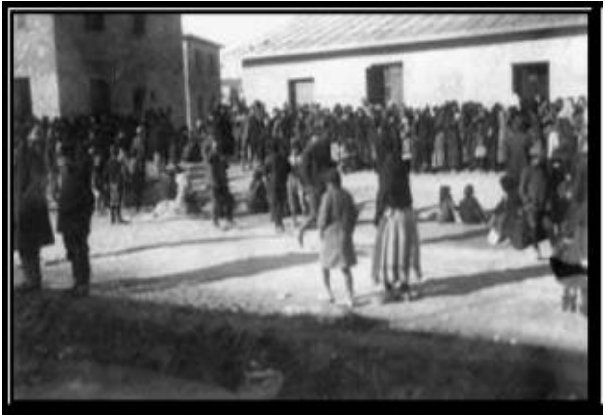
Εικόνα1:Προσέλευση προσφύγων στη Νέα Ιωνία(ΚΕ.ΜΙ.ΠΟ.)

Αρχικά γίνεται η εγκατάσταση περίπου πεντακοσίων (500) οικογενειών στην περιοχή των ποδαράδων, που ήταν μια περιοχή γεμάτη λόφους, θάμνους και αμπέλια, η περιοχή επιλέχθηκε καθώς πληρούνταν δύο βασικές προϋποθέσεις, η πρώτη προϋπόθεση ήταν η πρόσβαση σε άφθονο και καθαρό νερό και οι ανάγκες των κατοίκων εξυπηρετούνταν από τον ποταμό Ποδονίφτη, ενώ δεύτερη και εξίσου σημαντική προϋπόθεσή για την επιλογή της περιοχής εγκατάστασης ήταν οι κάτοικοι της να έχουν την δυνατότητα να μεταβαίνουν εύκολα και γρήγορα προς το κέντρο της Αθήνας και η προϋπόθεσή αυτή πληρούνταν, καθώς την περιοχή την διέσχιζε η σιδηροδρομική γραμμή του τρένου Πειραιάς- Κηφισιά επιτρέποντας με την δημιουργία σταθμού οι κάτοικοι να μετακινούνται προς το κέντρο. Με την δημιουργία του αρχικού οικισμού άρχισαν να συγκεντρώνονται πρόσφυγες από ολόκληρη την Μικρά Ασία, συγκεκριμένα από τις περιοχές, Ινέπολη, Κασταμονή, Σμύρνη, Αλάια, Βουρλά, Απάλεια, καθώς επίσης απο τον Πόντο, την Καππαδοκία, τη Σαφράμπολη, τη Νεάπολη, το Ικόνιο, το Αϊβαλί, τα Θυάτειρα και άλλες περιοχές της Μικράς Ασίας. Οι πρώτοι πρόσφυγες προσπαθούσαν να οργανώσουν τη ζωή τους προσωρινά καθώς πίστευαν ότι