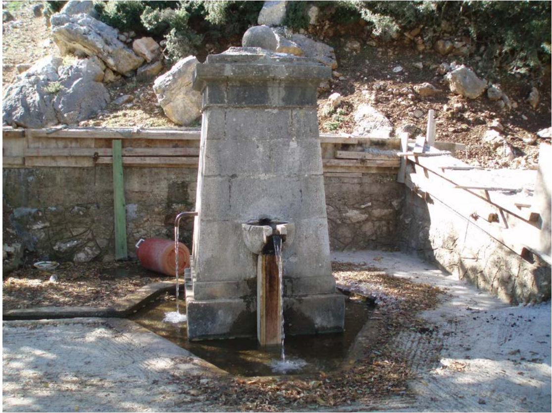
η βρύση «Ράχη» χτισμένη το 1907