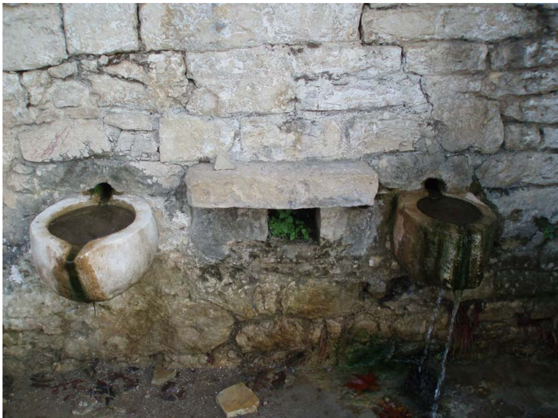
ΟΙ ΓΟΥΡΝΕΣ ΤΗΣ ΒΡΥΣΗΣ