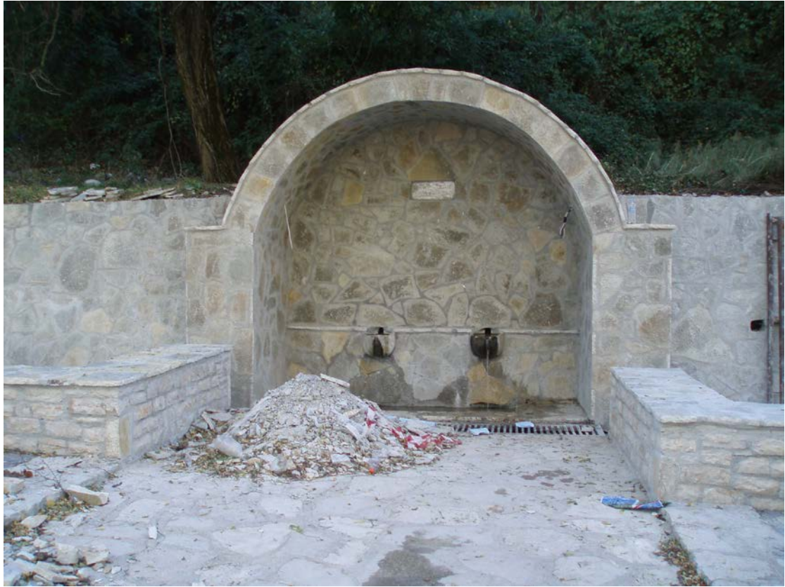
Η αναδιαμορφωμένη Βρύση «Γαυροβίκος» χτισμένη το 1977