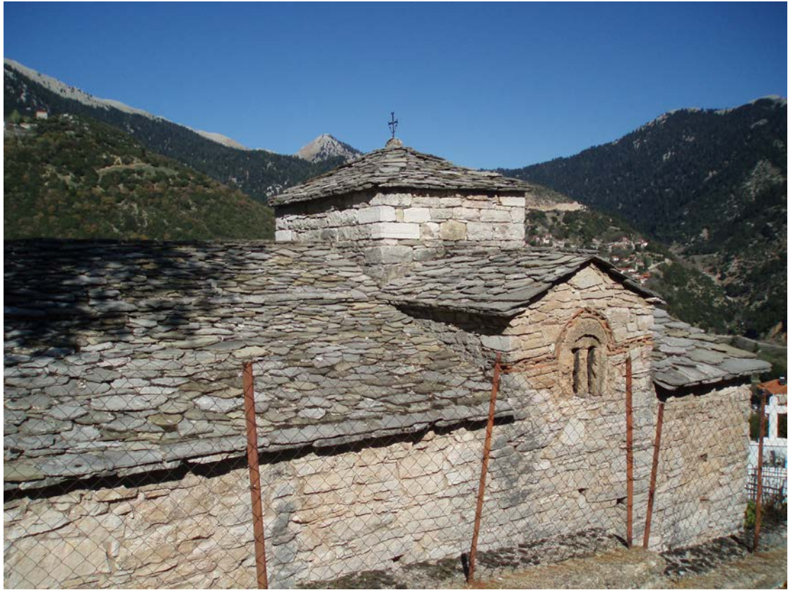
Η ΕΚΚΛΗΣΙΑ ΠΟΥ ΒΡΙΣΚΕΤΑΙ ΣΤΟ ΔΡΟΜΟ ΚΑΘΩΣ ΑΝΕΒΑΙΝΟΥΜΕ ΣΤΟ ΔΡΟΜΟ ΓΙΑ ΤΗΝ ΚΡΗΝΗ