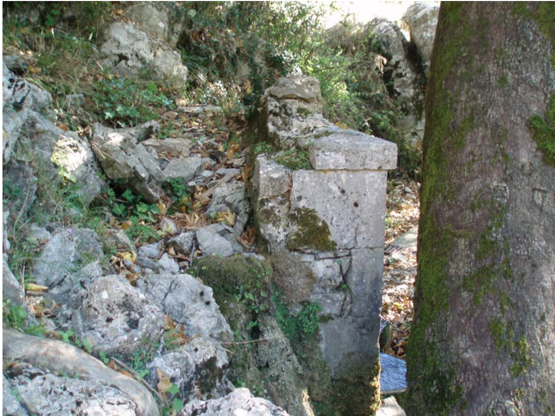
ΤΟ ΠΙΣΩ ΜΕΡΟΣ ΤΗΣ ΒΡΥΣΗΣ ΚΑΙ ΤΟ ΛΕΤΩΜΑ ΤΗΣ ΕΙΝΑΙ ΚΑΤΕΣΤΡΑΜΜΕΝΑ