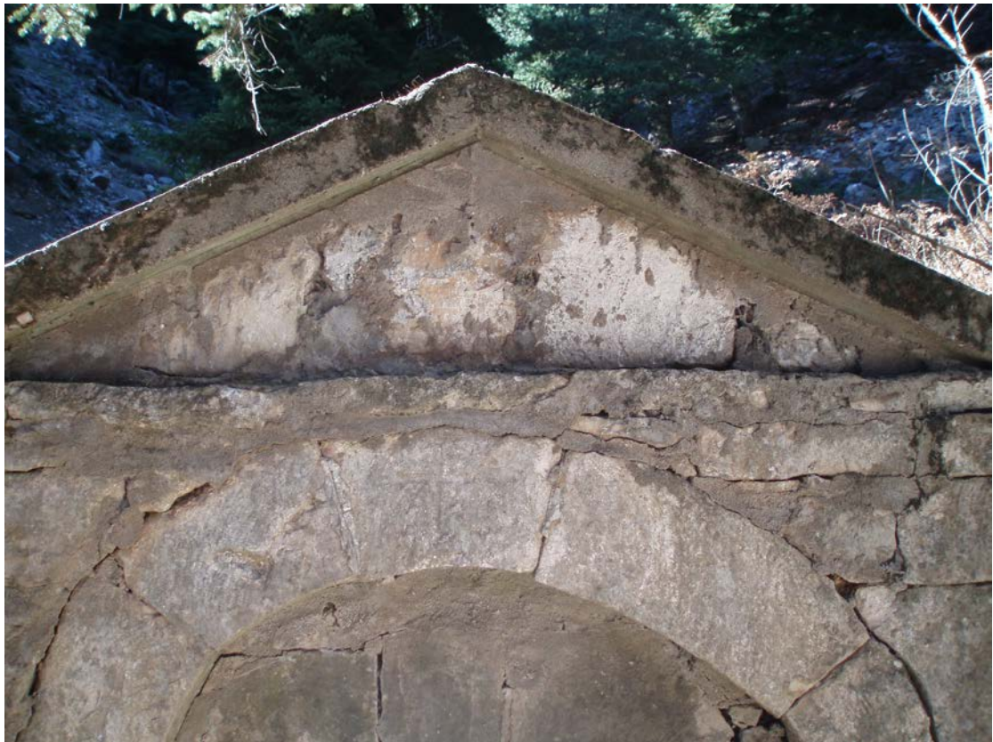
ΤΟ ΑΕΤΩΜΑ ΤΗΣ ΒΡΥΣΗΣ