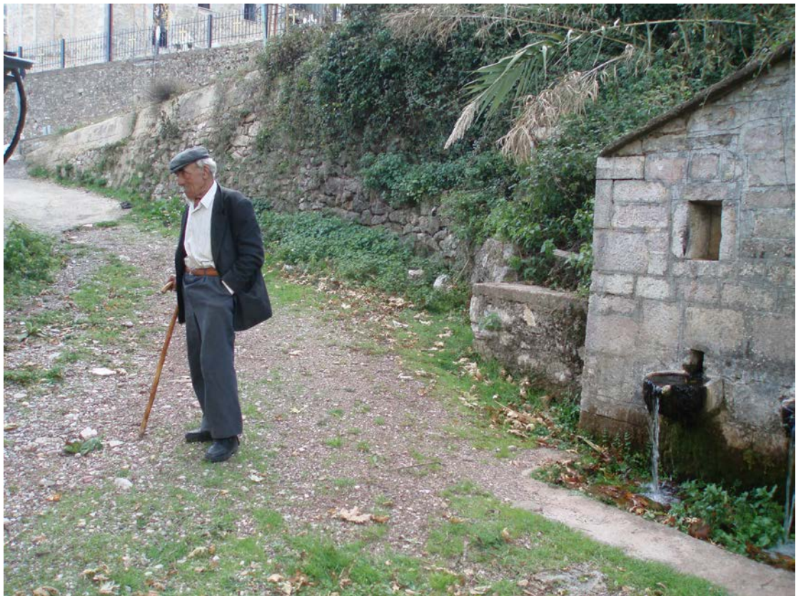
Ο ΠΑΠΠΟΥΣ ΣΤΕΚΕΤΑΙ ΜΕ ΚΑΜΑΡΙ ΔΙΠΛΑ ΣΤΗΝ ΒΡΥΣΗ ΤΟΥ ΧΩΡΙΟΥ ΤΟΥ ΚΑΙ ΦΕΡΝΕΙ ΜΝΗΜΕΣ ΑΠΟ ΤΟ ΠΑΡΕΛΘΟΝ ΚΑΘΩΣ ΜΑΣ ΔΙΗΓΕΙΤΑΙ ΓΕΓΟΝΟΤΑ ΠΟΥ ΣΥΝΕΒΗΣΑΝ ΚΟΝΤΑ ΣΤΗΝ ΒΡΥΣΗ.