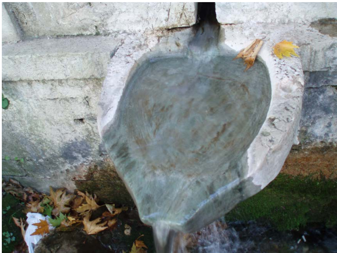
ΜΙΑ ΑΠΟ ΤΙΣ ΓΟΥΡΝΕΣ ΤΗΣ ΒΡΥΣΗΣ