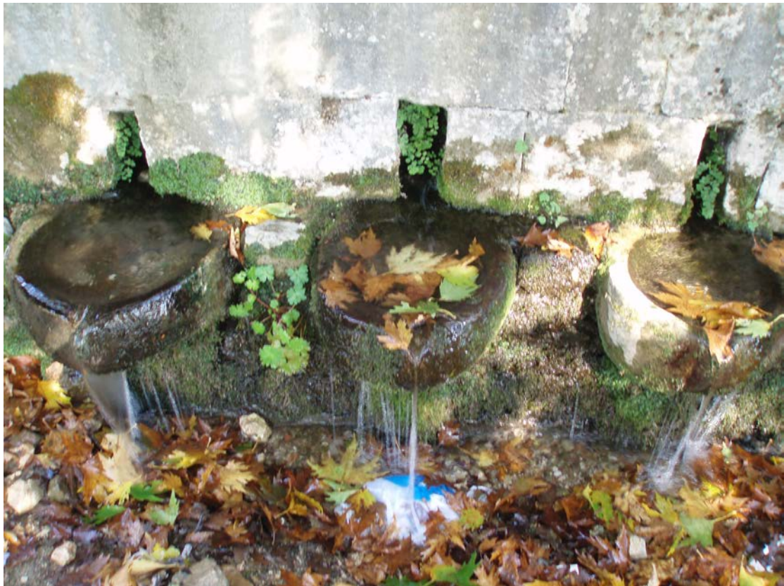
ΟΙ ΓΟΥΡΝΕΣ ΤΗΣ ΒΡΥΣΗΣ