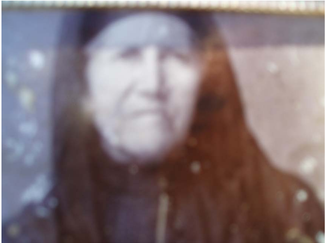
Η ΙΔΡΥΤΡΙΑ ΤΗΣ ΚΡΗΝΗΣ