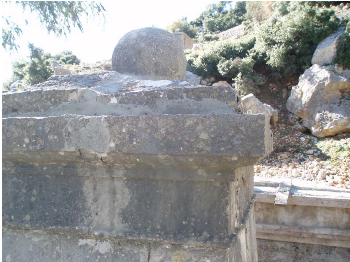
ΤΟ ΕΠΑΝΩ ΜΕΡΟΣ ΤΗΣ ΚΡΗΝΗΣ ΚΑΤΕΣΤΡΑΜΜΕΝΟ