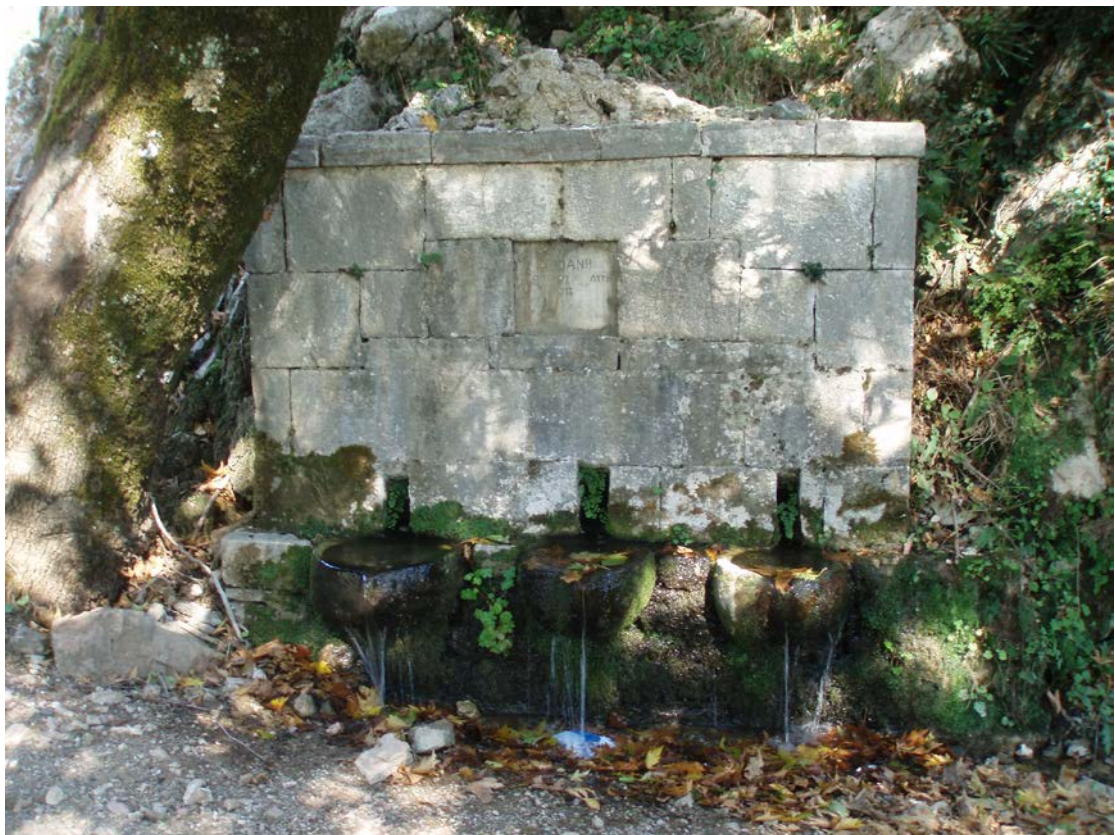
η βρύση «κοκκινου» χτισμένη το 1913 στον Πέρα Μαχαλά