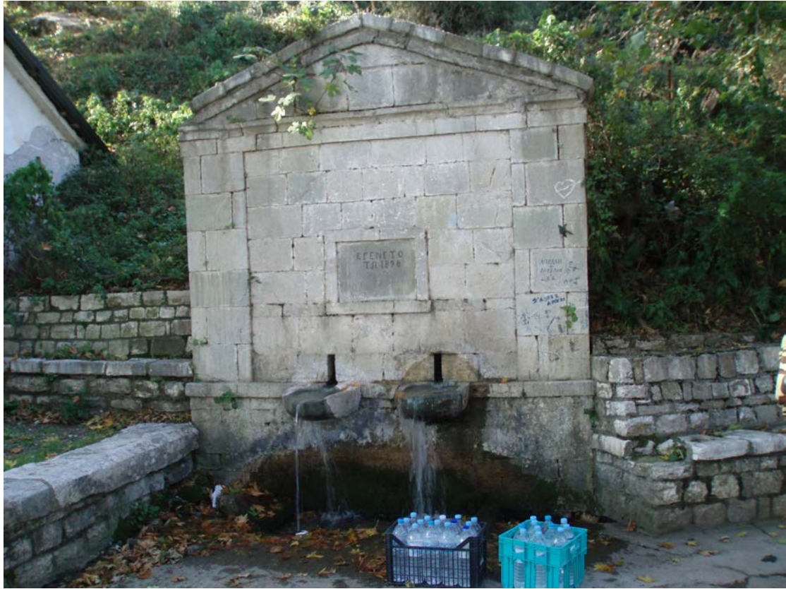
Η βρύση μοριός χτισμένη το 1898