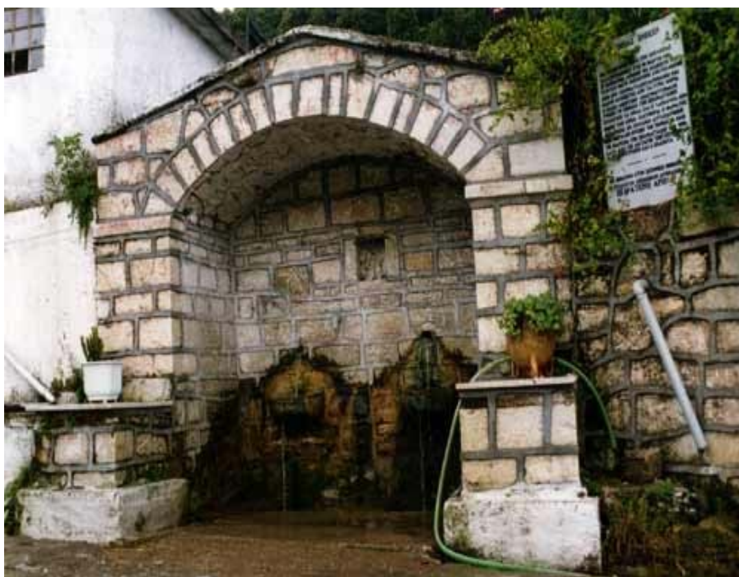
Η ΑΝΑΔΙΑΜΟΡΦΩΜΕΝΗ ΠΑΡΑΔΟΣΙΑΚΗ ΒΡΥΣΗ ΚΕΝΤΡΟ ΤΟΥ ΧΩΡΙΟΥ