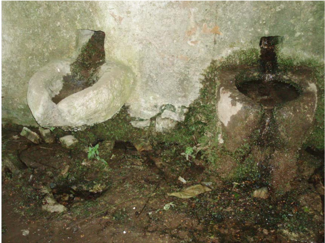
ΟΙ ΓΟΥΡΝΕΣ ΤΗΣ ΒΡΥΣΗΣ