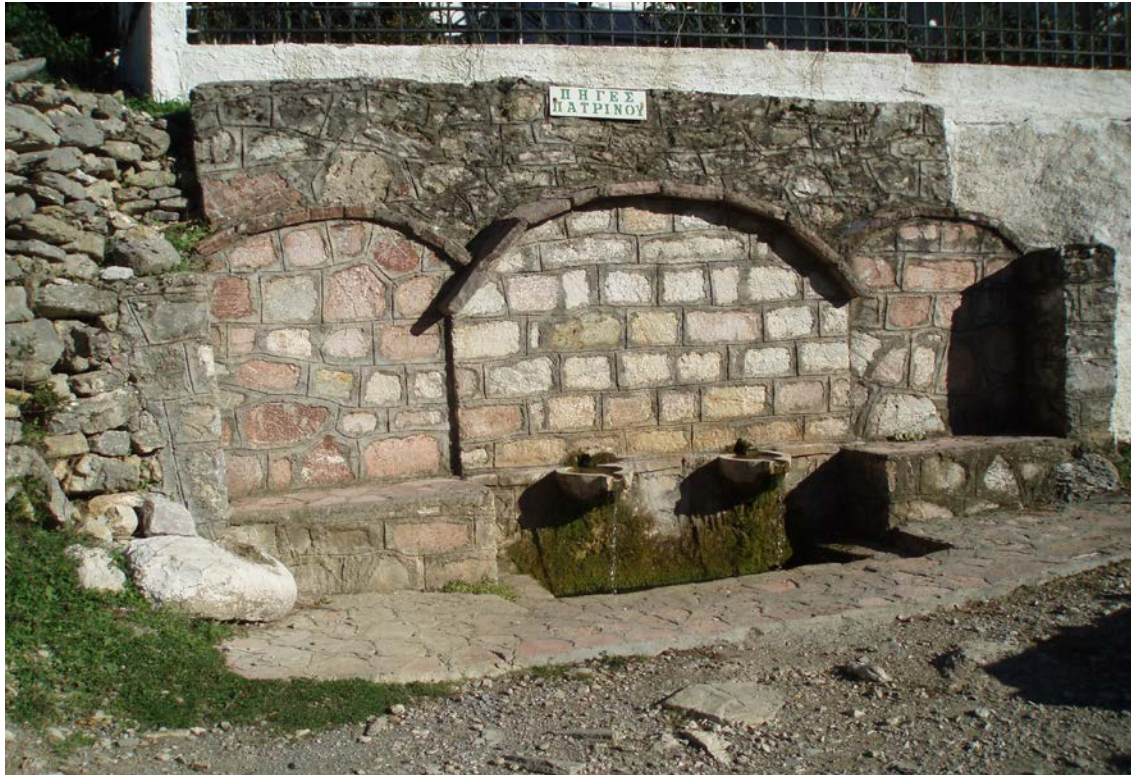
Βρύση στην Πηγή Πατρινού

Χωριό του Δήμου Λαμπείας με 252 κατοίκους.