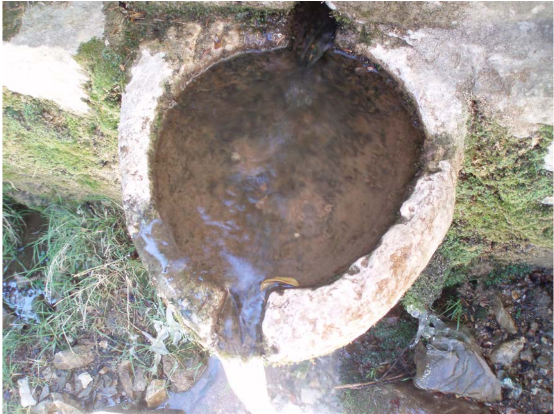
Η ΓΟΥΡΝΑ ΤΗΣ ΒΡΥΣΗΣ