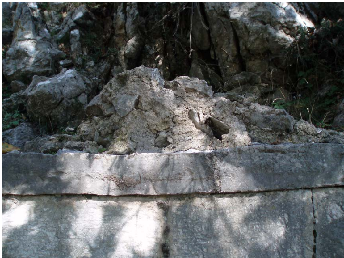
ΤΟ ΛΕΤΩΜΑ ΤΗΣ ΒΡΥΣΗΣ