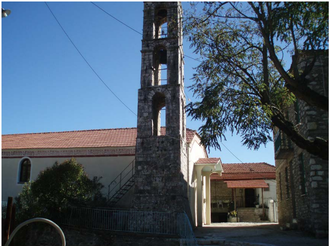
ΕΝΑ ΑΠΟ ΤΑ ΑΡΧΑΙΟΤΕΡΑ ΚΑΜΠΑΝΑΡΙΑ ΛΙΓΟ ΠΙΟ ΚΑΤΩ ΑΠΟ ΤΗΝ ΚΡΗΝΗ