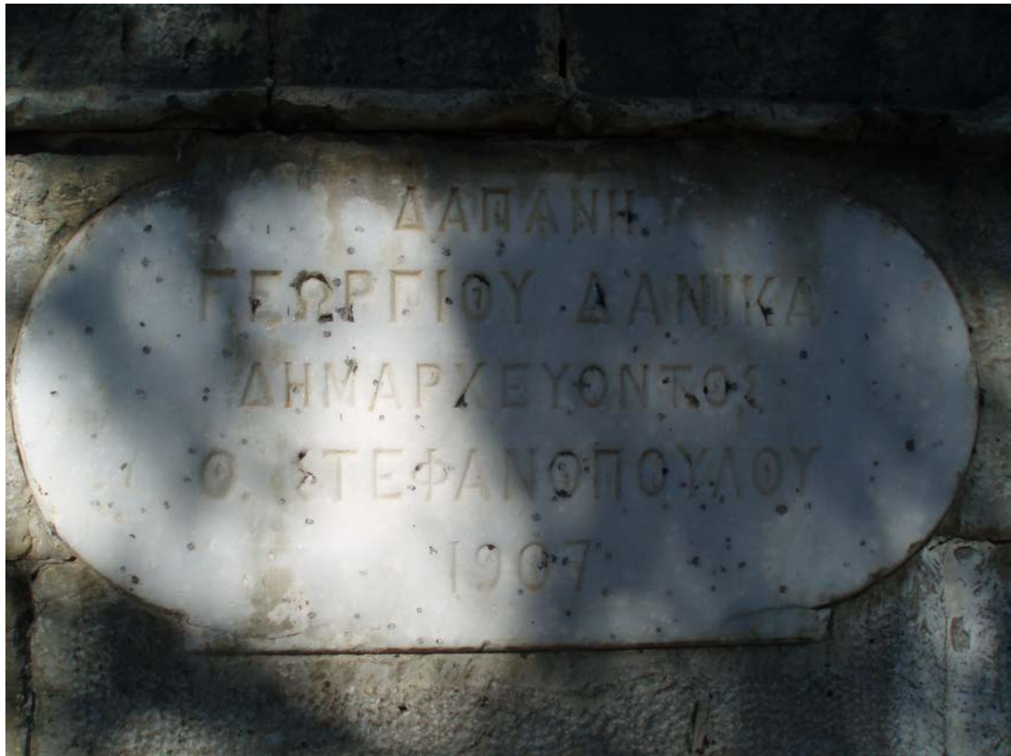
Η ΕΠΙΓΡΑΦΗ ΤΗΣ ΚΡΗΝΗΣ «ΔΑΠΑΝΗ ΓΕΩΡΓΙΟΥ ΔΑΝΙΚΑ ΔΗΜΑΡΧΕΥΟΝΤΟΣ Ο. ΣΤΕΦΑΝΟΠΟΥΛΟΥ 1907»