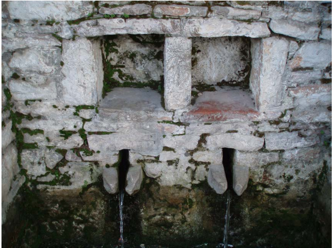
ΟΙ ΘΥΡΙΔΕΣ ΚΑΙ ΟΙ ΓΟΥΡΝΕΣ ΤΗΣ ΚΡΗΝΗΣ