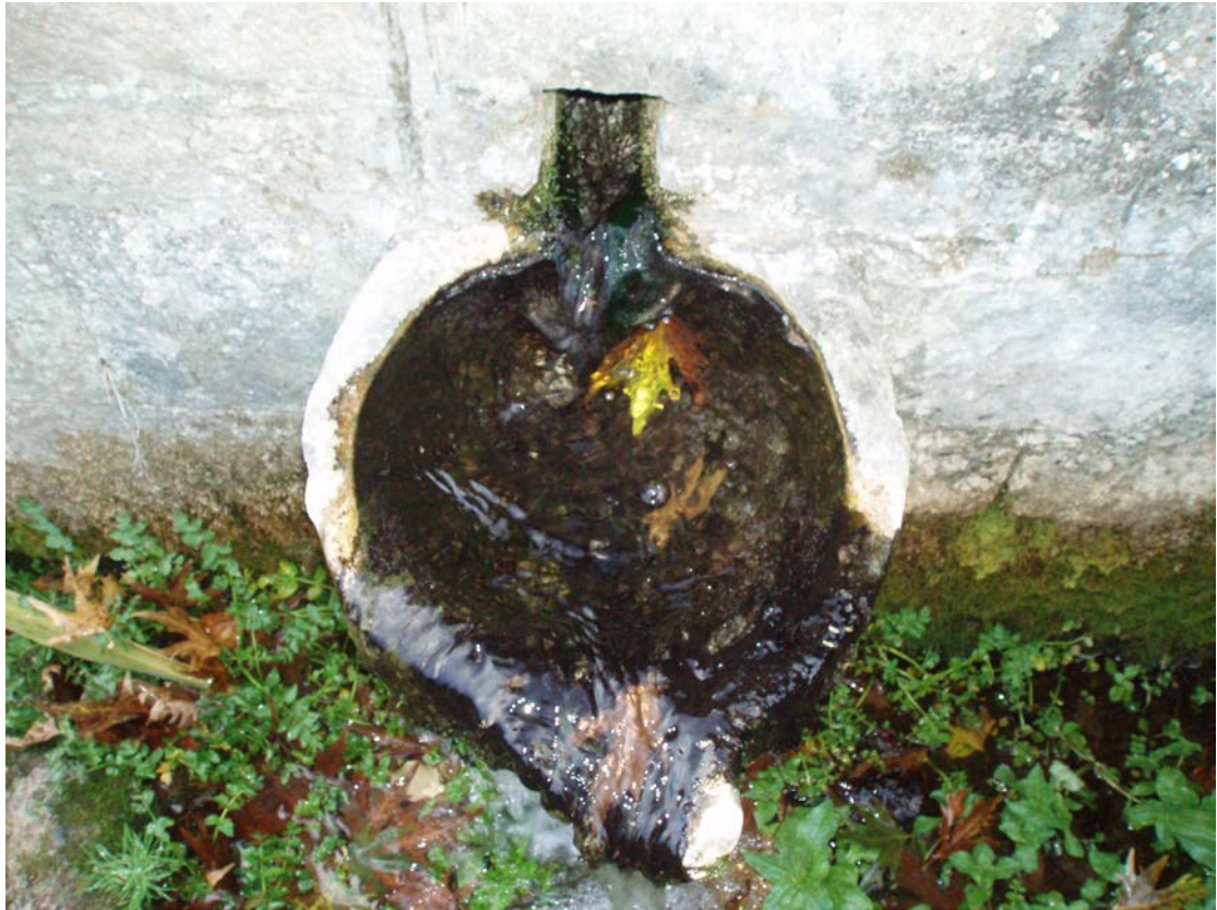
ΜΙΑ ΑΠΟ ΤΙΣ ΓΟΥΡΝΕΣ ΤΗΣ ΚΡΗΝΗΣ