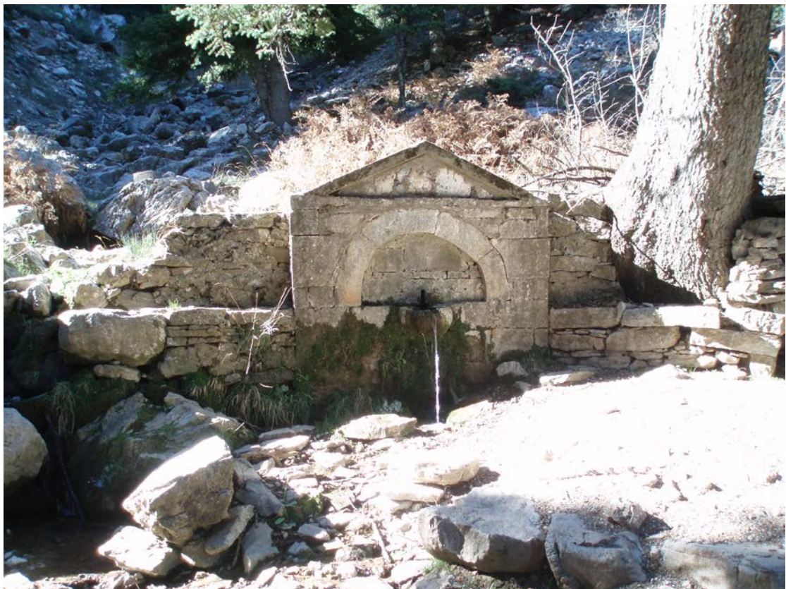
η βρύση «Αβορίτσα» στην Άνω μονή Χρυσοπηγής