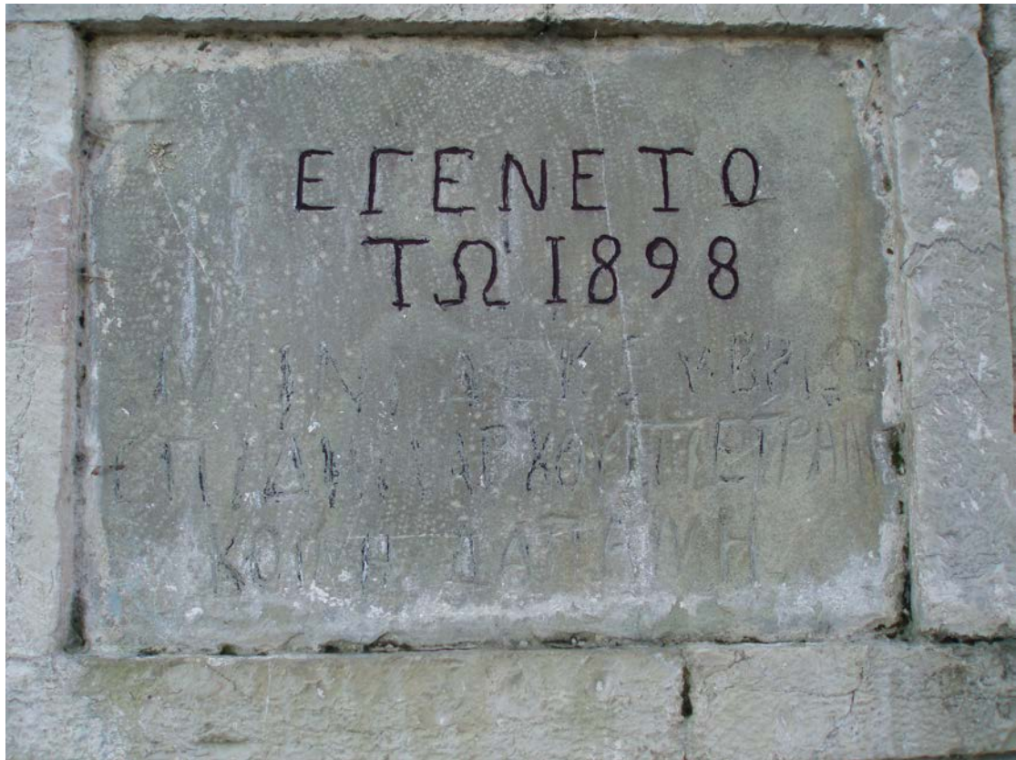
Η ΕΠΙΓΡΑΦΗ ΤΗΣ ΒΡΥΣΗΣ