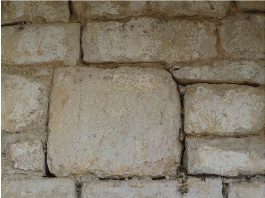
Η ΕΠΙΓΡΑΦΗ ΤΗΣ ΒΡΥΣΗΣ