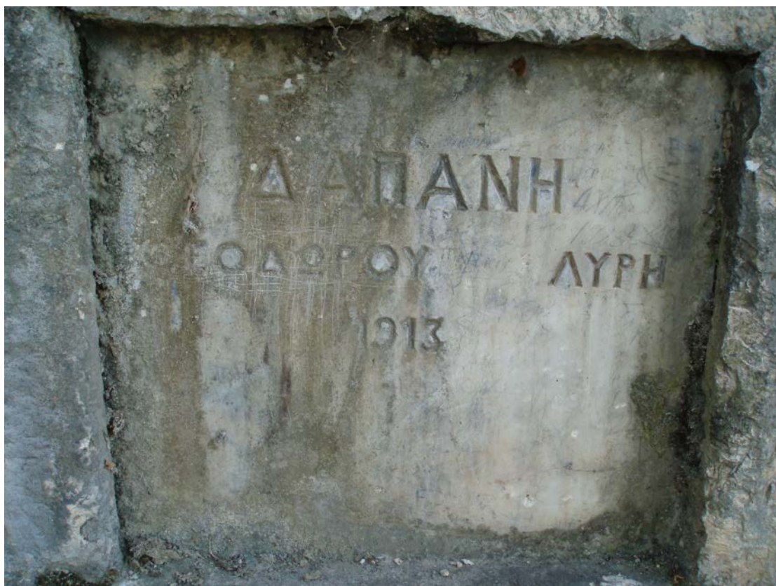
Η ΕΠΙΓΡΑΦΗ ΤΗΣ ΒΡΥΣΗΣ «ΔΑΠΑΝΗ ΘΕΟΔΩΡΟΥ ΛΥΡΗ 1913»