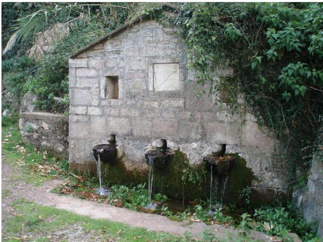
η βρύση «καθολική» χτισμένη στις 30 Μαΐου 1899