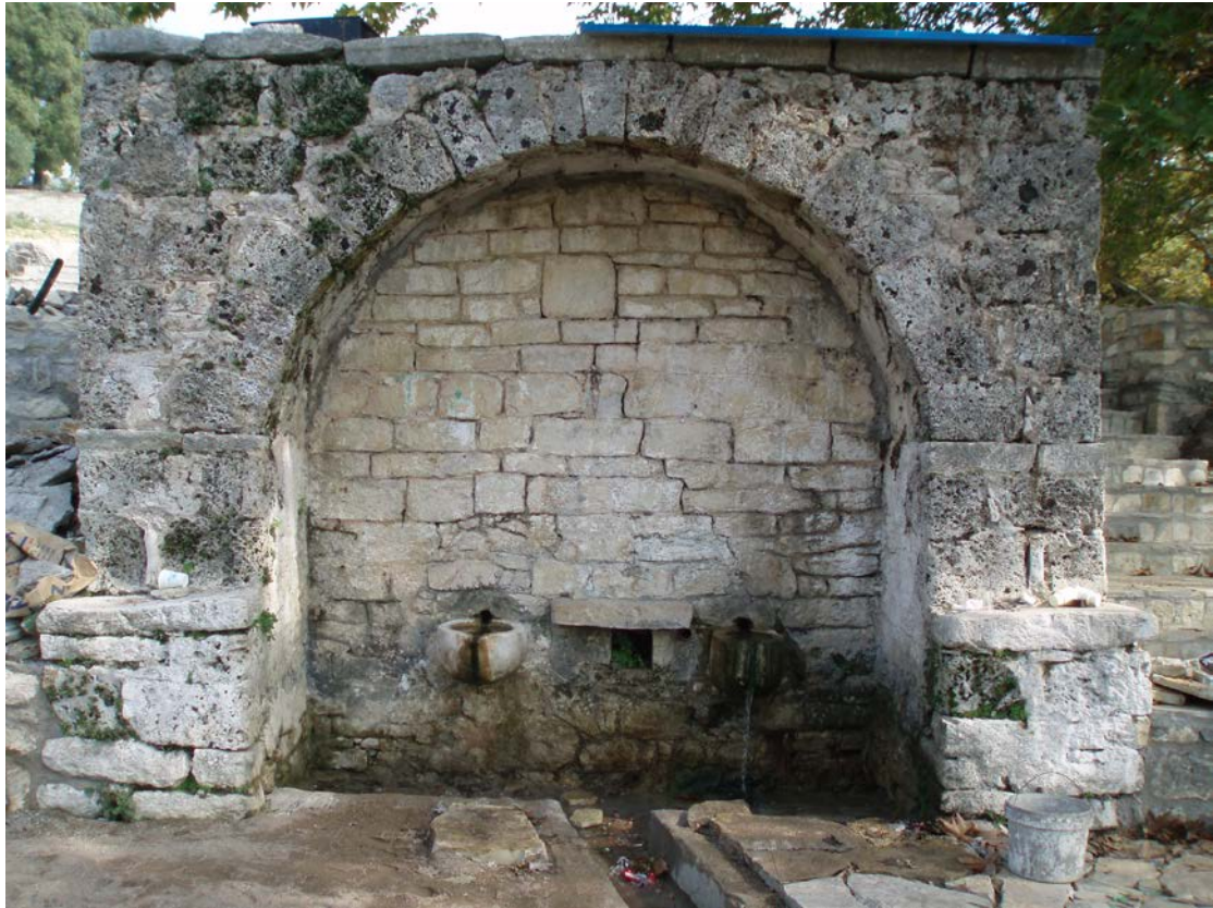
ΧΤΙΣΜΕΝΗ ΑΠΟ ΠΕΤΡΑ ΤΟ 1853