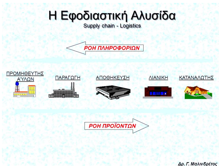
Εικόνα 2: Ροή εφοδιαστικής αλυσίδας

Από την άλλη πλευρά ο όρος περί διαχείρισης της εφοδιαστικής αλυσίδας παρουσιάστηκε τις τελευταίες δεκαετίες και περιγράφει την έννοια των ολοκληρωμένων logistics τονίζοντας την αλληλεξάρτηση και την επίδραση μεταξύ διαφόρων τμημάτων μέσα σε μια επιχείρηση και πως αυτή διαφοροποιείται, στον τομέα του ανταγωνισμού, από τις υπόλοιπες επιχειρήσεις όμοιων δραστηριοτήτων. Οι εταιρείες δεν παύουν ποτέ να ψάχνουν τον κατάλληλο τρόπο διαχείρισης της εφοδιαστικής αλυσίδας με κύριο σκοπό την μείωση του κόστους και παράλληλα την αύξηση των κερδών. Για να επιτευχθεί σωστά όλη η διαδικασία, από την παραγωγή ενός προϊόντος / υπηρεσίας μέχρι την τελική διάθεση στον καταναλωτή, με την βέλτιστη οικονομική απόδοση στην επιχείρηση, απαιτείται τόσο μία σωστή διοίκηση, όσο και η αποτελεσματική οργάνωση.