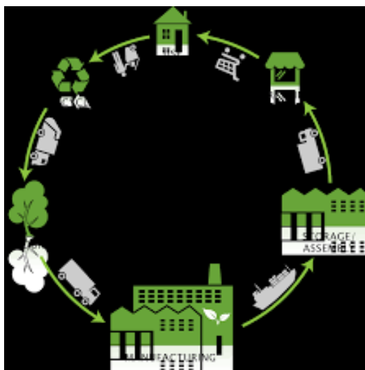
Εικόνα 5 : Στάδια διαχείρισης κύκλου ζωής προϊόντος

Συνοψίζοντας λοιπόν τα παραπάνω, ένα προϊόν θα μπορούσε να χαρακτηριστεί πράσινο όταν οι περιβαλλοντικές του επιδράσεις σε σχέση με την παραγωγή, την χρήση και την διάθεση έχει βελτιωθεί στο μέγιστο συγκριτικά με τα συμβατικά-ανταγωνιστικά προϊόντα τονίζοντας την σπουδαιότητα ολόκληρου του κύκλου ζωής του αγαθού και όχι μόνο της παραγωγικής φάσης.