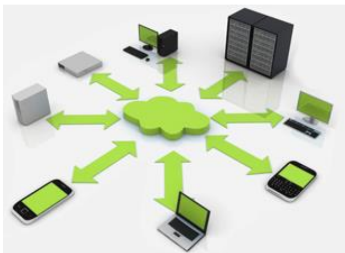
Εικόνα 8: Green IT

Το κόστος αγοράς και εγκαταστάσεις πράσινος πληροφοριακών συστημάτων δεν θα