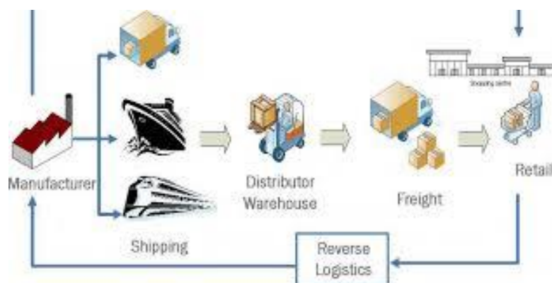
Εικόνα 6: Reverse Logistics / Αντίστροφη Αλυσίδα

επισκευή άλλων όμοιων προϊόντων και τέλος ο τρόπος της ανακύκλωσης. Πιο συγκεκριμένα για την διαδικασία της ανακύκλωσης, τα χρησιμοποιημένα προϊόντα και εξαρτήματα κατακερματίζονται σε αναγνωρίσιμα τμήματα τα οποία εν συνεχεία διαχωρίζονται σε διαφορετικές κατηγορίες υλικών και επαναχρησιμοποιούνται στην παραγωγή νέων κομματιών.