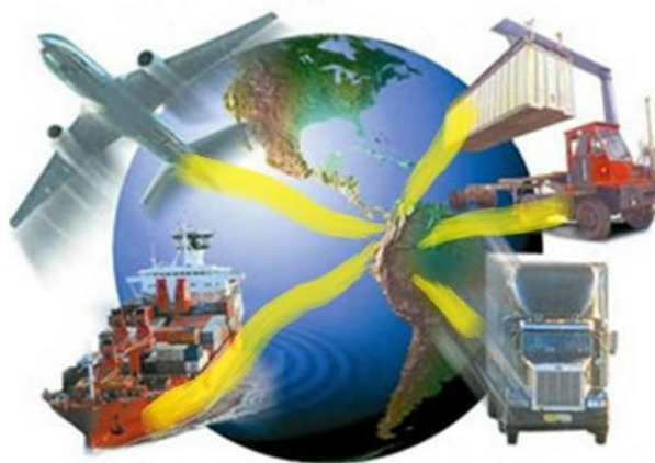
Εικόνα 3: Επίδραση των Μέσων Μεταφοράς στον πλανήτη

Οι αρνητικές επιδράσεις των διάφορων παραγωγικών συστημάτων και των εταιρειών που ασκούνται στο περιβάλλον, αλλά και το ανάποδο, κρίνουν απαραίτητη την υιοθέτηση και την εφαρμογή νέων μέτρων ώστε να μειωθεί το μέγεθος της καταστροφής που ήδη έχει προκληθεί. Τα τελευταία χρόνια γίνονται διάφορες εκστρατείες για την καταγραφή καθώς και την αντιμετώπιση αυτής της παγκόσμιας οικολογικής καταστροφής του φυσικού περιβάλλοντος μέσω της ενημέρωσης με σκοπό την ευαισθητοποίηση του κόσμου, την ίδρυση φορέων και περιβαλλοντικών οργανισμών για την κινητοποίηση δραστηριοτήτων και ενεργειών αλλά και την δημιουργία και την υπογραφή πρωτόκολλων για την τήρηση κανόνων και θεσμών.